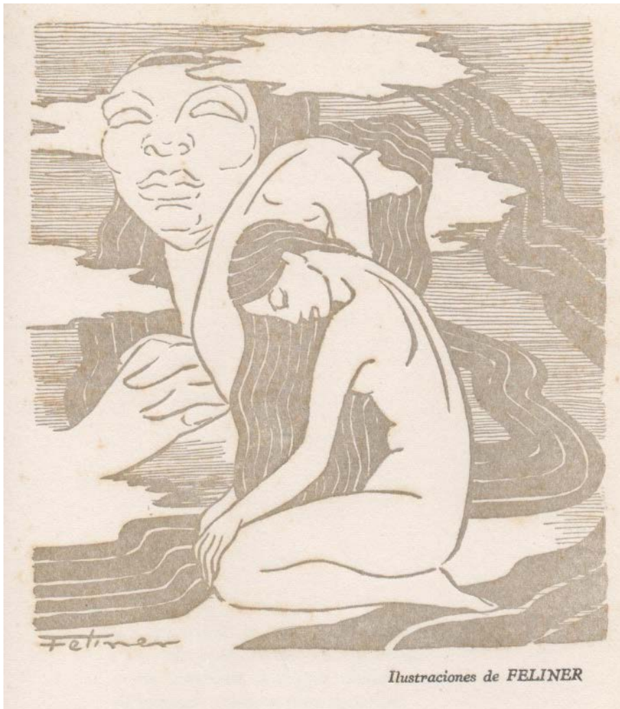
Ilustración tomada del libro La tarde y ella (1947).