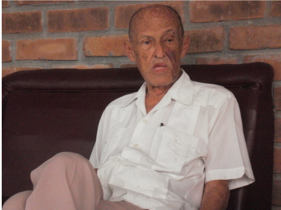
Fotografía tomada por el autor de la investigación, en el Valle del Cauca, junio de 2014.