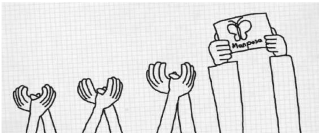
Ilustración 4 Lengua de Señas Colombiana.

Yo pienso que necesitamos más aprendizaje de la lengua de señas, que la universidad entienda qué va pasar con el futuro de los sordos, que entienda sobre la discapacidad sobre la forma de nosotros comunicarnos, no como antes, que no hay de pronto ese conocimiento, que nosotros también nos sentimos unas personas conocedoras, que las personas que tienen conocimientos o que están dentro de la universidad sepan que hay discapacidad, pero que igual las leyes se pueden construir y las leyes se cumplan, que nosotros venimos a la universidad con muchos sueños y cuando vemos que las personas, cuando se encuentran con personas sordas, no saben qué hacer, usted es sordo, quédese acá, yo creo que nosotros no estamos en igualdad de condiciones y necesitamos equipararlo con medidas para el futuro. Que no vean a las personas con discapacidad desde la lástima y sin exigencia, que se nos exija como a cualquier otra persona. Cuando entran a la universidad sienten un impacto entre lo que venían aprendiendo y lo que ya se les exige.