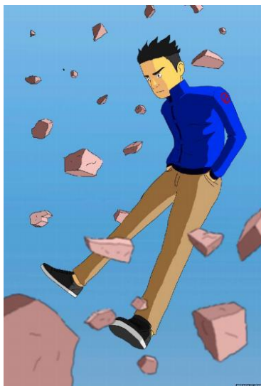
Ilustración 1. La experiencia de ser estudiante.