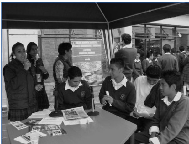
Usando los equipos de la emisora