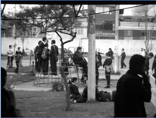
En el patio de clases tomando su descanso