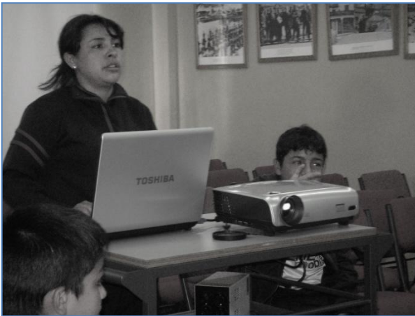
Haciendo uso de las TIC en el colegio