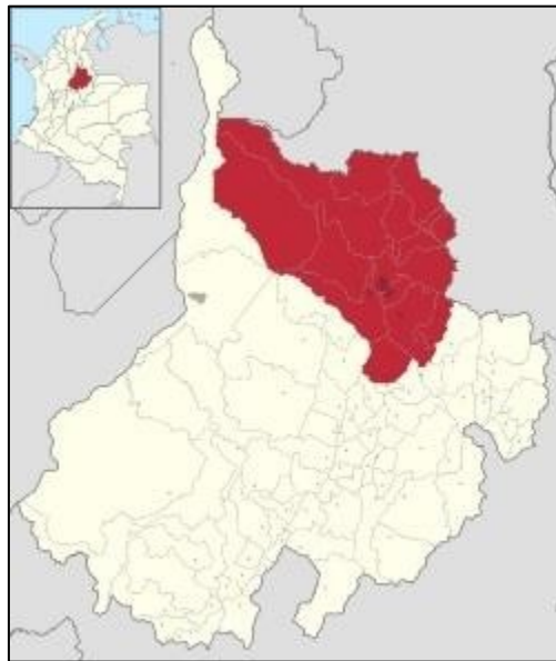
Figura 2. Localización de la Provincia de Soto Norte. Fuente: Una historia y una vida alrededor del oro: territorialidad y minería en el municipio de Vetás, Santander (Buitrago, 2014).

Este conflicto de intereses entre la industria minera y el medio ambiente, tiene como ubicación específica la Provincia de Soto Norte, al nororiente del Departamento de Santander, tal como se ilustra en la figura 2 a continuación.