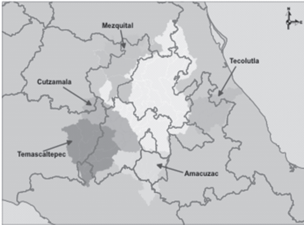
Mapa 1. Cuencas presentes y futuras para el aprovisionamiento de agua a la ZMVM.