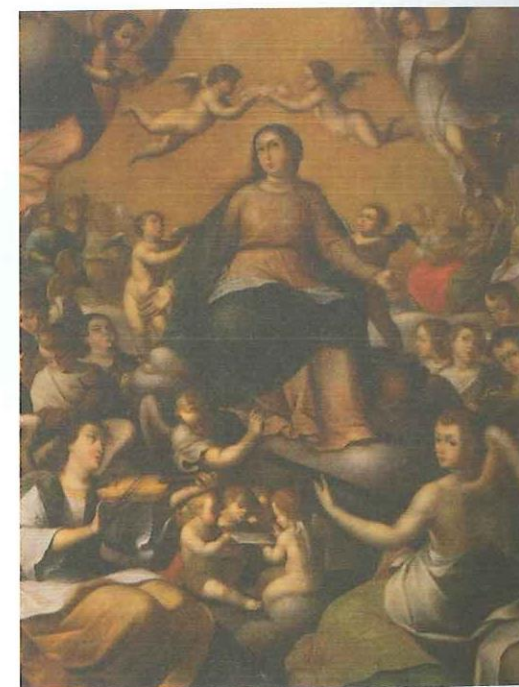
Figura 1. La Virgen de los ángeles, 1673. Óleo sobre lienzo, 218 x 175 cm. Banco de la República, Bogotá. Colombia.

maestras de artistas europeos que se elaboraban en España, Italia y los Países Bajos, y que llegaban a sus manos en forma de grabados o lienzos. De esta manera, Ceballos llevó a cabo reinterpretaciones de obras de Reni, Murillo, Ribera, Rubens, Sassoferrato y Zurbarán, entre otros.