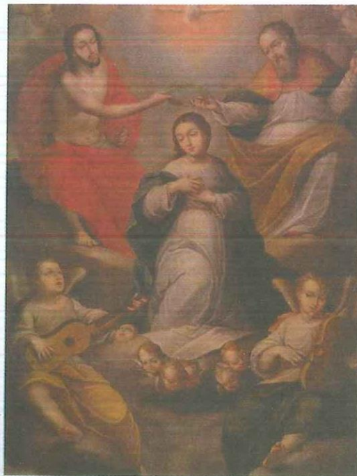
Figura 2. Coronación de la Virgen María, 1697. Óleo sobre lienzo, 152 X 117 cm. Museo de Arte Colonial, Bogotá, Colombia.

Sin embargo, entre las piezas que aún se conservan y que se encuentran disponibles para estudio, se hallan 13 pinturas que incluyen elementos musicales.