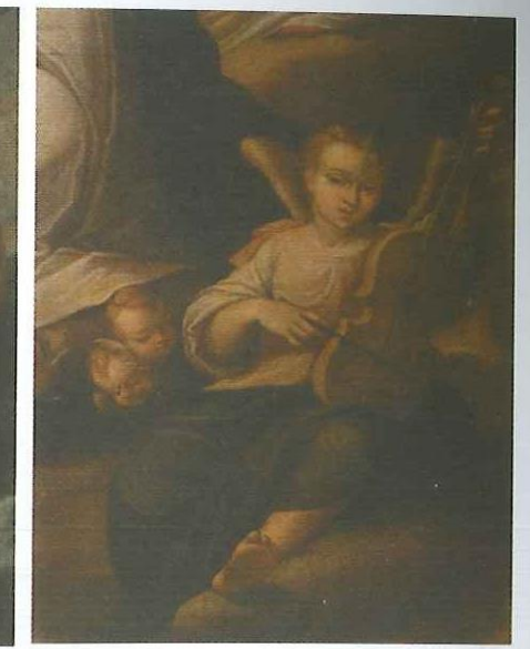
Figura 5. Coronación de la Virgen María, 1697. Óleo sobre lienzo, 152 x 117 cm. Museo de Arte Colonial, Bogotá, Colombia.