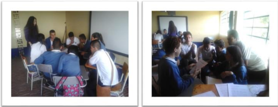
Figura 3 Grupo focal alumnos grado 10

interesan en su participación debido a la falta de promoción, consideran que ECOSUCRE es la única entidad que defiende el medio ambiente en su Municipio.