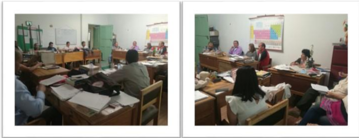
Figura 4 Grupo focal docentes.

En cuanto a las principales problemáticas que afectan a la mayoría de los jóvenes del Municipio consideran las siguientes: descomposición familiar, dificultades económicas, problemas de comportamiento, falta de oportunidades, discriminación política, desorientación en su proyecto de vida, apatía por parte de los jóvenes, embarazos a temprana edad, falta de orientación en temas de educación sexual, necesidad de ocupar su tiempo libre, entre otras. Expresan que las únicas iniciativas de emprendimiento juvenil que se han desarrollado en el Municipio son una fábrica de hostias, elaboración de manillas, denarios y camándulas. Consideran que varios de los programas de emprendimiento juvenil que serían viables para el Municipio son: capacitar a los jóvenes en las diferentes disciplinas, formación de microempresas, emprendimiento económico, convenios con entidades del mercado laboral, incentivos de emprendimiento agrícola, creación de cooperativas que les brinde apoyo económico, creación de asociaciones, creación de procesos de comercialización y mercadeo, entre otros.