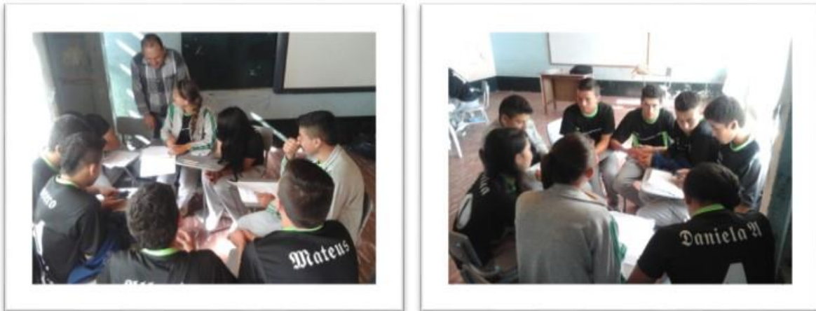
Figura 1 Grupo focal jóvenes de grado 11-A

2.2.2 Grupo focal con jóvenes de grado 11-B. Los jóvenes de este grupo manifiestan que la principal fuente de economía en su Municipio es la agricultura y la ganadería y aportan a ella su conocimiento y su trabajo, pero se sienten desestimados ya que por su aporte no reciben ningún tipo de remuneración. En cuanto al principal lugar de encuentro, expresan que la biblioteca del colegio, la cancha o el parque es el sitio de reunión de los jóvenes del Municipio; allí encuentran espacios de participación para desarrollar actividades deportivas, artísticas y culturales. Los jóvenes de este grupo consideran que la banda musical del colegio es la única organización comunitaria y juvenil existente. Así mismo no se sienten identificados al no tener participación en las diferentes actividades.