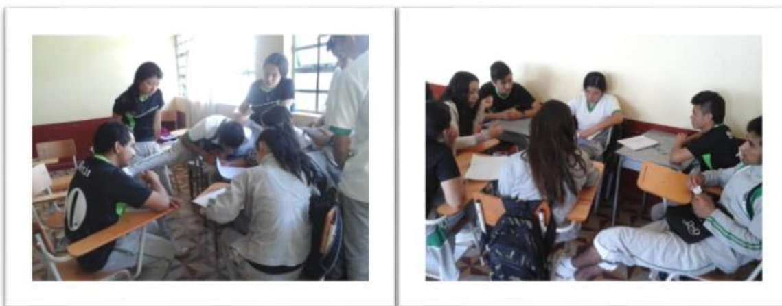
Figura 2 Grupo focal alumnos grado 11-B.

formación profesional, técnica y tecnológica, construir gimnasios deportivos, realizar concursos incluyan a jóvenes de la zona rural, fortalecer el comercio, apoyo del Estado para proyectos agrícolas, mejoramiento de la infraestructura de las instituciones educativas, mejoramiento de vías del Municipio, entre otras.