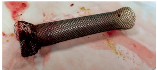
Figura 5. Stent esofágico retirado.

Con respecto al manejo quirúrgico, su realización ha disminuido debido a los avances en las técnicas endoscópicas, a la TIPS y al trasplante hepático; sin embargo, solo es una terapia efectiva en algunos pacientes seleccionados. Se divide en dos categorías: los procedimientos sin cortocircuito, que incluyen la transección esofágica y la devascularización gastroesofágica; y los procedimientos con cortocircuito, en los cuales tenemos los selectivos,