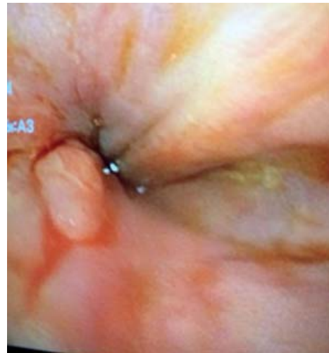
Figura 4. Ausencia de varices esofágicas.

del 80%; en casos de resangrado, como ya se mencionó, es del 50%, al retiro del balón (4). En estos pacientes se ha podido identificar que el principal error en la falla del control de la hemorragia es la ubicación del balón a nivel de la unión gastroesofágica. Se debe tener presente que se trata de una terapia puente por un máximo de 24 horas y que su eficacia depende del operador, con un 6% a 20% de complicaciones fatales, como la perforación esofágica, y un 10% a 20% de riesgo de broncoaspiración asociado con encefalopatía de base (1). En nuestro caso, al no contar con un balón de Sengstaken-Blakemore, se intentó emplear el balón de dilatación de acalasia con el mismo principio de acción, sin tener éxito en el control del sangrado.