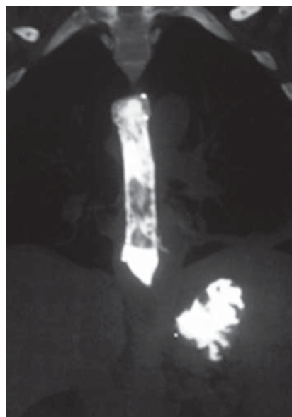
Figura 1. Stent esofágico con fístula esófago pleural.

Se considera perforación esofágica y el paciente es llevado a cirugía para drenaje por mediastinitis aguda, esofagorrafia más rotación de colgajo del músculo intercostal y decorticación pleural. Se inicia manejo antibiótico con linezolid y meropenem. En su evolución hay evidencia de formación de una fístula esofágica con subsecuente resolución a la tercera semana de tratamiento médico (figura 1). El paciente es sometido a TIPS, sin complicaciones. A la cuarta semana se retira el stent esofágico parcialmente recubierto, bajo anestesia general y guía radiográfica que muestra incorporación proximal del stent en la pared esofágica (figura 2), el cual se libera con tracción progresiva y extracción del mismo sin complicaciones. Se revisa el esófago y se observa que hay ausencia de úlceras o várices esofágicas y que la perforación está resuelta (figuras 3, 4 y 5). A las 24 horas, el paciente tolera la vía oral y es dado de alta.