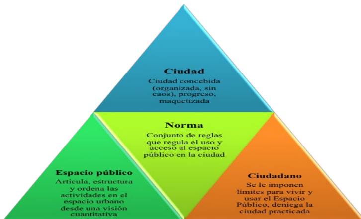
Figura 1. La norma con relación al espacio público, la ciudad y el ciudadano.

en ese espacio modélico [el cual] no prevé la posibilidad de que irrumpa el conflicto, puesto que la calle y la plaza contemplan la realización de la utopía de una superación absoluta de las diferencias de clase y las contradicciones sociales, por la vía de la aceptación común de un saber comportarse que iguala. (Delgado, 2012, p. 62)