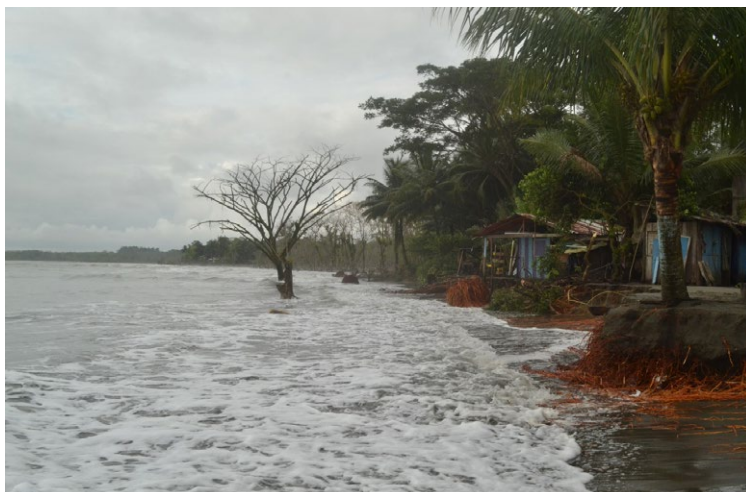
Imagen 2. La Barra, diciembre de 2018.