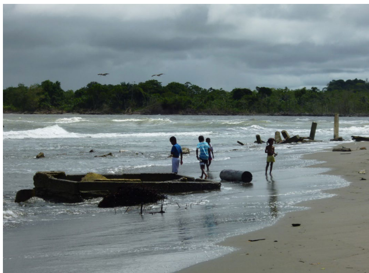
Imagen 1. La Barra, julio de 2016.

lugar en que habitan y que el agua puja por recuperar. Parece ser que es también violentamente arrebatado: no sólo el mar se lo lleva todo. Viejas y nuevas destrucciones suscitadas por conmociones telúricas y sociales muestran que en La Barra el mundo colapsa constantemente en tanto se abre camino en medio de los escombros que el mar, el capital y la guerra dejan.