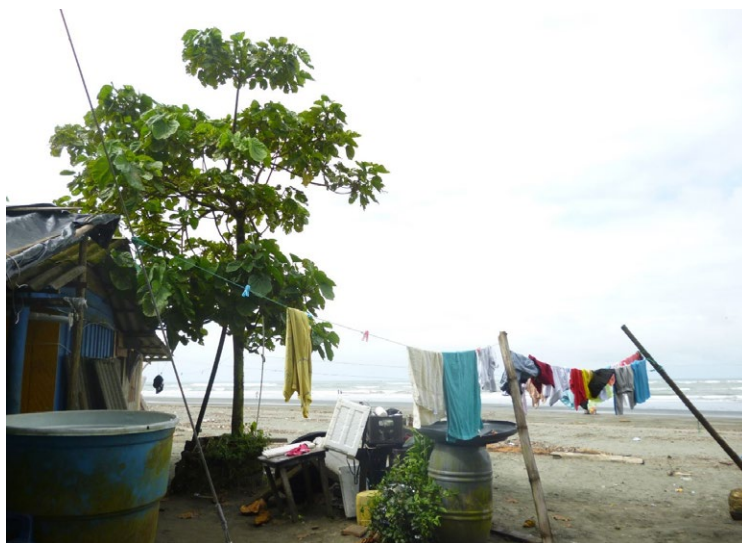
Imagen 4. La Barra, diciembre de 2019.