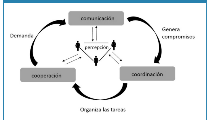
Figura 1 Modelo de las 3C

Con estos roles se puede dar inicio al desarrollo e implementación de proyectos en el área de la telesalud, ya que algunas enfermedades están presentes en sujetos en regiones alejadas de las ciudades principales, cuya información generan estudios que deben ser analizados en la brevedad posible y a su vez se generan preguntas e hipótesis, que deben ser igualmente tomadas en cuenta para su estudio 10 .