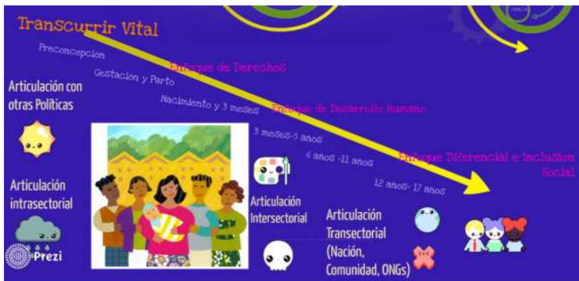
Figura 3-2: Análisis Situacional del Ejercicio de Derechos de Niños, Niñas y Adolescentes y Oferta Programática Fuente: Prezi. Presentación elaborada por Lorena Gómez Reyes el 5 de mayo de 2014.

En particular en relación con el trabajo infantil la SDIS identifica los casos de trabajo infantil por medio de un equipo de búsqueda activa e invita a los identificados a participar, a través de las redes locales, en los centros de atención y restablecimiento de derechos (Centros amar para la población de 6 a 17 años, acunar para la población de 0 a 5 años). De otra