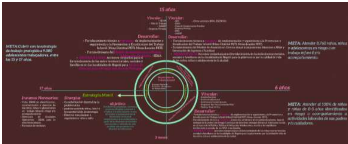
Figura 3-3: Prezi. Presentación elaborada por Lorena Gomez Reyes el 30 de abril de 2014, Disponible en: http://prezi.com/hcpcnwlxwvxj/bogota-libre-de-trabajo-infantil .

Estrategia que diferencia acciones generales para todos los niños, niñas y adolescentes (de entre 3 meses y 17 años) y acciones en relación ciclos por edades en relación con la este grupo poblacional (según sea de 3 a 5 años, de 6 a 14 años y de 15 a 17 años).