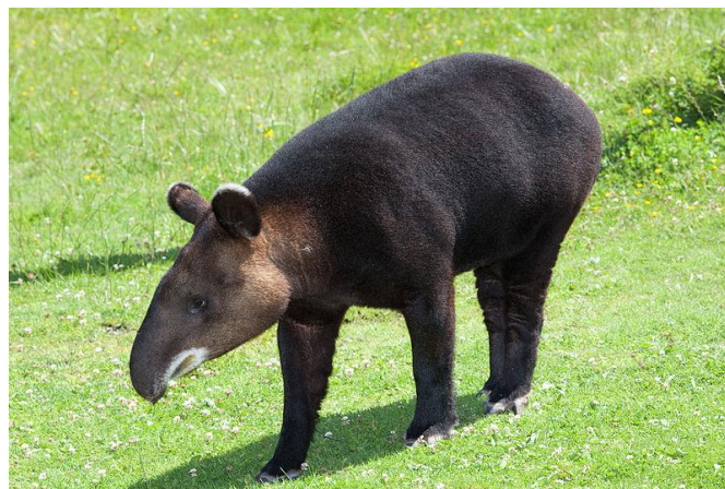
Figura 1. Individuo adulto del tapir de montaña ( Tapirus pinchaque Roulin)

Entre ellas, se propuso la realización del presente proyecto con la finalidad de establecer un sistema de monitoreo e investigación del tapir de montaña ( Tapirus pinchaque ; Figura 1). La observación de esta especie en su hábitat natural está empezando a ser realizada por empresas de orientación ecoturística.