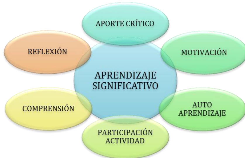
Figura 4. Ventajas del aprendizaje significativo

conocimiento, de acuerdo con sus habilidades y destrezas individuales. (Grupo Editorial Norma, 2011).