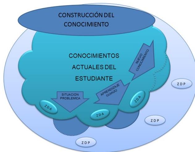
Figura 2. Interpretación del aprendizaje de Vygotski

El autor constructivista Lev Vygotski propone que el estudiante alcanza sus aprendizajes de la siguiente manera: Con sus actuales saberes se encuentra en la Zona de Desarrollo Actual (ZDA), en su búsqueda por aprender encuentra las dificultades y las sorteas para avanzar a la denominada Zona de Desarrollo Próximo (ZDP), por sí solo no llega a desarrollar todo su potencial de aprendizaje, pero el estudiante adquiere una función activa, donde se parte de su conocimiento cotidiano para ir relacionando con el conocimiento sistemático por medio del diálogo, en el intercambio de opiniones con el respaldo de un docente o un compañero más avanzado, se pueden alcanzar progresivamente mayores aprendizajes dentro de esta zona (ZDP). (Segura, 2005).