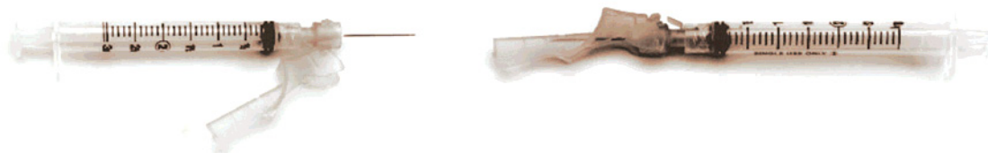
Figura 3. Aguja con protección tipo bisagra