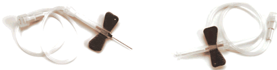
Figura 6. Aguja con aletas con dispositivo de seguridad