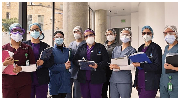
Figura 1. nutritionDay en Colombia, Hospital San Carlos, Bogotá.

busca que se respete el derecho fundamental al cuidado nutricional y, por ende, que todos los pacientes reciban una terapia nutricional óptima y oportuna. Desde hace varios años se ha podido apoyar a otros países en la realización del nutritionDay , con lo cual Latinoamérica ha podido beneficiarse de la experiencia de Colombia.