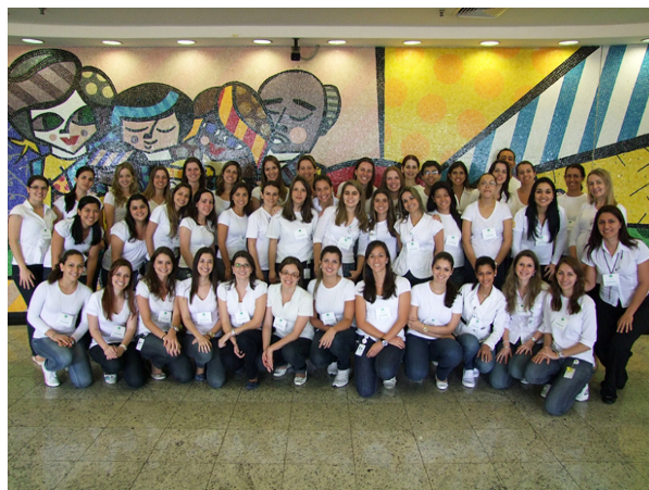
Figura 7. nutritionDay Brasil, Instituto do Câncer do Estado de São Paulo (ICESP).