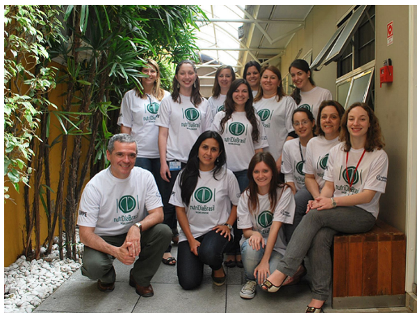
Figura 6. nutritionDay Brasil, Hospital Escola da Universidade Federal de Pelotas/Empresa Brasileira de Servicios Hospitalarios.