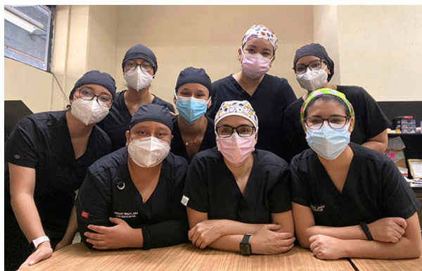
Figura 4. nutritionDay en Guatemala, Hospital General San Juan de Dios, Guatemala.

Colombia y Ecuador se han mostrado muy activos generando artículos científicos, pósters y conferencias socializando los datos del nutritionDay (4-6) . Además, a mediados de este año, nutritionDay Ecuador junto con la Escuela Politécnica del Litoral (ESPOL) realizaron la tra-