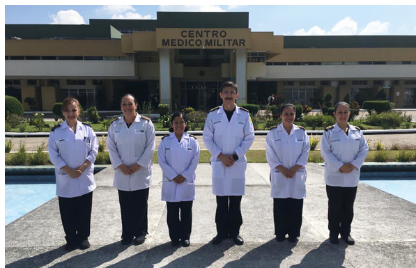
Figura 5. nutritionDay en Guatemala, Hospital Centro Médico Militar.