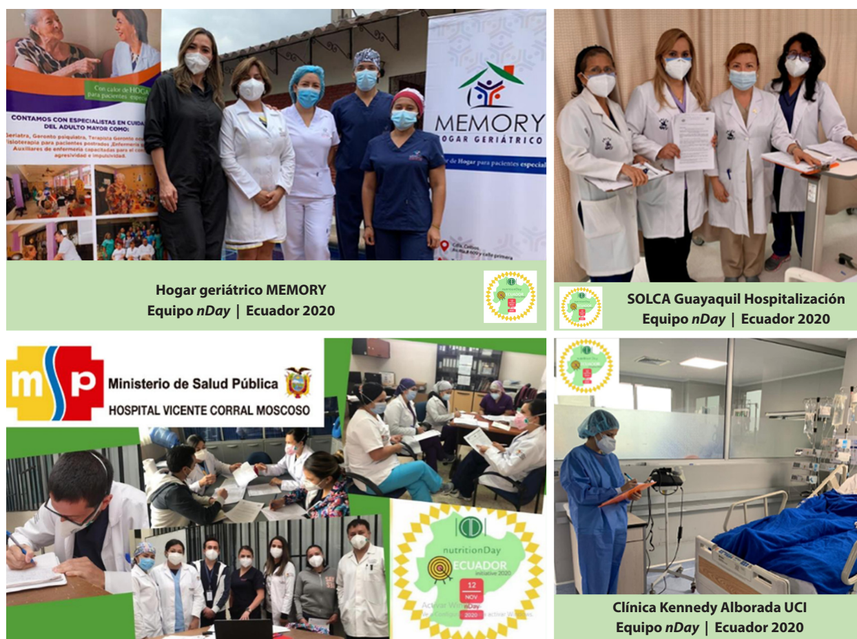
Figura 3. Colaboradores de diferentes centros participantes en el nutritionDay Ecuador.

En Brasil, el nutritionDay empezó en 2009, a partir de una iniciativa coordinada por la Dra. María Cristina