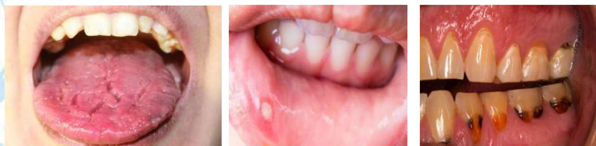
Fig. a. Gură uscată