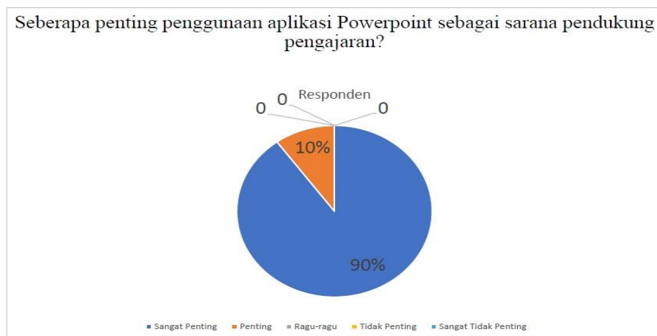
Gambar 11. Hasil Kuesioner Tentang Pentingnya Penggunaan Aplikasi Powerpoint untuk Mendukung Sarana Pengajaran

Pada diagram Gambar 10 memberikan penjelasan bahwa sebanyak 85% peserta merasa materi yang disampaikan sangat sesuai dengan kebutuhan atau tema dan 15% peserta merasa sudah sesuai. Pertanyaan selanjutnya yaitu seberapa penting penggunaan aplikasi Powerpoint sebagai pendukung kegiatan pembelajaran dan hasilnya dapat dilihat pada Gambar 11: