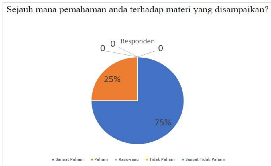
Gambar 12. Hasil Kuesioner Mengenai Pemahaman Peserta dalam Penggunaan Aplikasi Powerpoint

Pada diagram Gambar 12 menjelaskan bahwa sebanyak 75% peserta pelatihan sangat paham mengenai penggunaan aplikasi Powerpoint dalam pembuatan bahan ajar setelah kegiatan pelatihan dilakukan dan sisanya sebanyak 25% peserta pelatihan paham. Peserta pelatihan memahami penggunaan aplikasi Powerpoint dengan baik dan dapat mempraktikkan aplikasi Powerpoint dalam membuat bahan ajar yang menarik bagi siswa untuk mendukung proses pembelajaran.