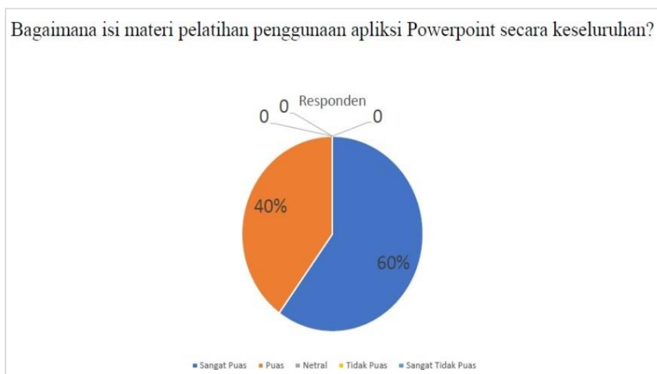
Gambar 9. Hasil Kuesioner Mengenai Kualitas Materi Pelatihan

Pada tahap akhir dilakukan evaluasi untuk mengukur keberhasilan kegiatan yang telah dilakukan dengan menyebar kuesioner kepada peserta. Kuesioner pertama mengenai kualitas materi pelatihan mengenai penggunaan aplikasi Powerpoint? Dan hasilnya dapat dilihat pada Gambar 9: