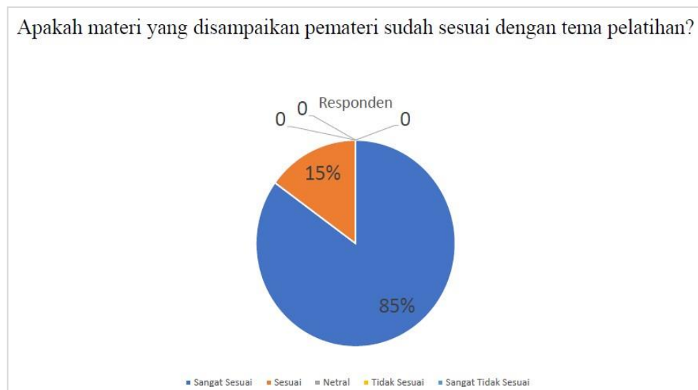
Gambar 10. Hasil Kuesioner Mengenai Kesesuaian Materi

Pada diagram Gambar 10 memberikan penjelasan bahwa sebanyak 85% peserta merasa materi yang disampaikan sangat sesuai dengan kebutuhan atau tema dan 15% peserta merasa sudah sesuai. Pertanyaan selanjutnya yaitu seberapa penting penggunaan aplikasi Powerpoint sebagai pendukung kegiatan pembelajaran dan hasilnya dapat dilihat pada Gambar 11: