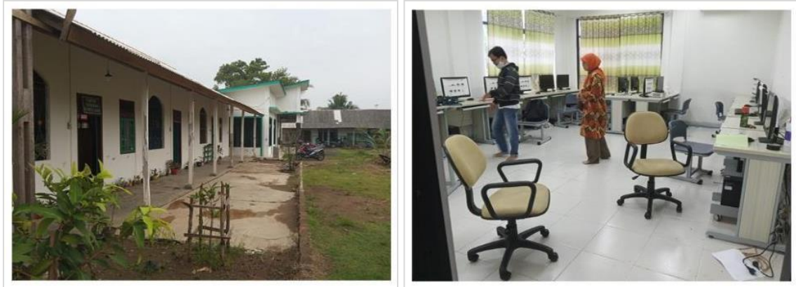
Gambar 1. Suasana Sekolah dan Laboratorium Komputer Madrasah Aliyah Ma'ariful Ulum Banyuwangi

Pembuatan modul pelatihan mengenai fundamental penggunaan aplikasi Powerpoint yang dibuat oleh Bapak D Tri Octafian. Pada Gambar 2 adalah contoh materi yang disampaikan pada kegiatan abdimas. Pada kegiatan abdimas difokuskan pada proses pelatihan penggunaan aplikasi Powerpoint berdasarkan studi kasus yang diangkat dari pertanyaan-pertanyaan para peserta pelatihan mengenai permasalahan dan kebutuhan yang dihadapi oleh guru selama pembuatan bahan ajar. Pada proses pelatihan tidak hanya menjelaskan penggunaan aplikasi Powerpoint saja, tetapi kolaborasi aplikasi Powerpoint dengan aplikasi pendukung lainnya, seperti: aplikasi penyunting gambar Photoshop, aplikasi penyunting video Camtasia dan Bandicam, dan aplikasi penyunting suara Audacity. Karena untuk menjawab beberapa studi kasus materi ajar seperti yang diinginkan oleh para guru Madrasah Aliyah Ma'ariful Ulum tidak bisa hanya dihasilkan oleh aplikasi Powerpoint saja, tetapi membutuhkan sumber lain, baik sumber tersebut berasal dari internet atau harus disunting terlebih dahulu oleh aplikasi lain.