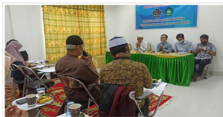
Gambar 5. Pembacaan Doa

Pembacaan doa sebelum pelatihan dimulai, dipimpin oleh salah satu peserta pelatihan seperti pada gambar 5.