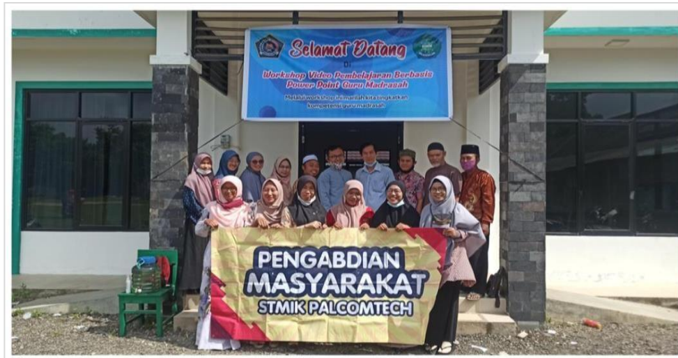
Gambar 8. Berfoto Bersama dengan Peserta Pelatihan

Pada tahap akhir dilakukan evaluasi untuk mengukur keberhasilan kegiatan yang telah dilakukan dengan menyebar kuesioner kepada peserta. Kuesioner pertama mengenai kualitas materi pelatihan mengenai penggunaan aplikasi Powerpoint? Dan hasilnya dapat dilihat pada Gambar 9: