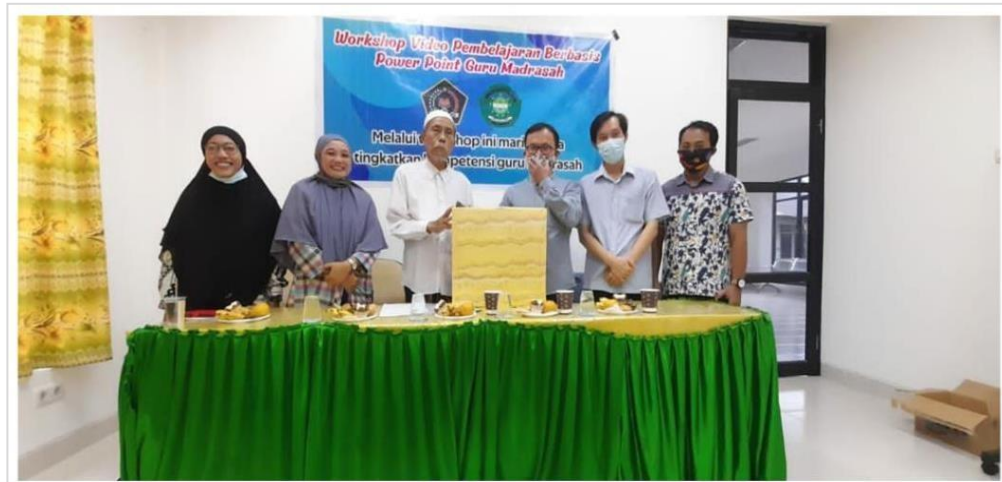
Gambar 6. Penyerahan Suvenir