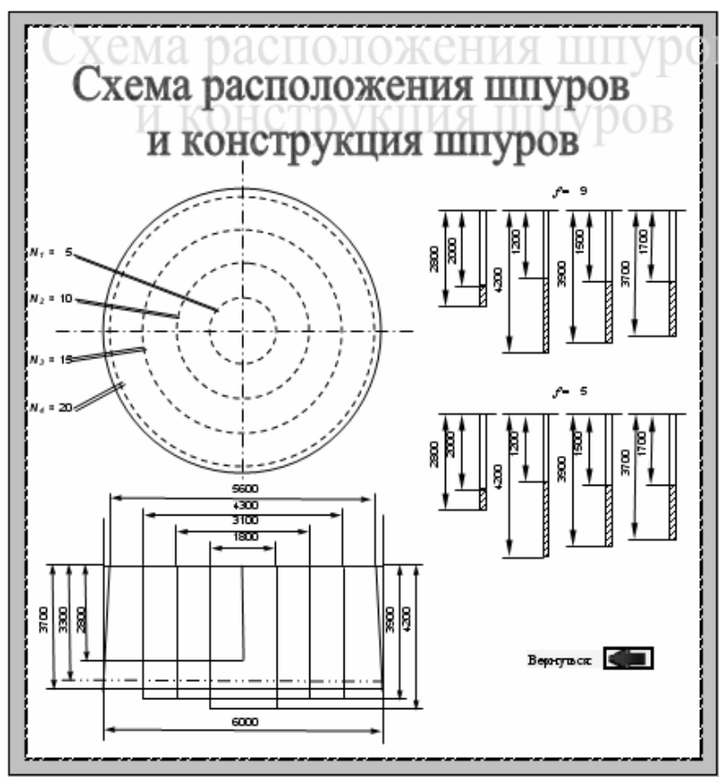
Рис. 2. Скриншот результатов программы

во и расположение шпуров на окружностях. В итоге все расчеты в программе сведены в таблицы и строится схема паспорта БВР (рис. 2). Расчеты можно проводить многократно, варьируя исходные горногеологические данные, что позволяет сравнивать показатели БВР и определять их технико-экономические параметры.