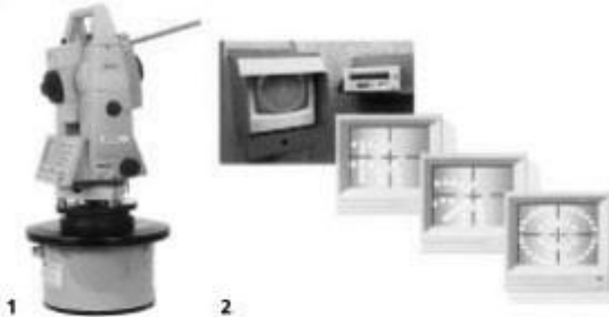
Рис. 4. Лазер для визначення траєкторії руху мікрощіта і лазерна мішень

- існуючі комунікації залишаються недоторканими;