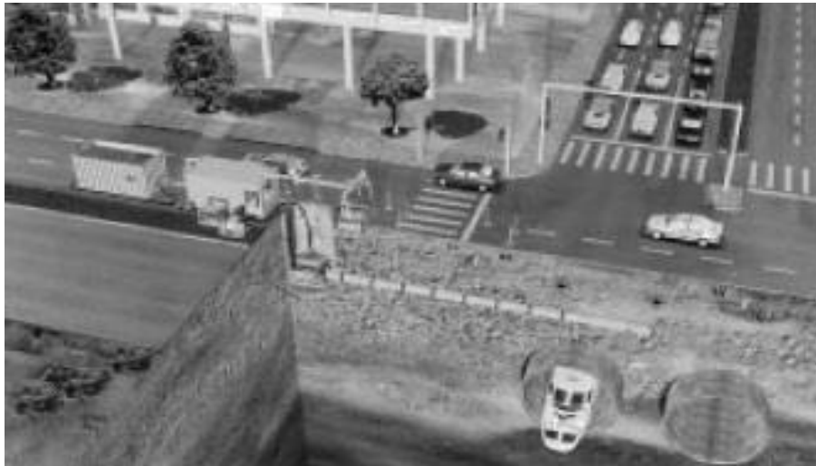
Рис. 1. Безтраншейна прокладка трубопроводу з застосуванням мікропрохідницького комплексу