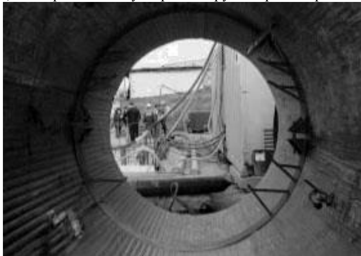
Рис. 3. Залізобетонна труба з форсунками для автоматичної подачі бентоніту і конструкцією для укладання труб

Таким чином, буровий розчин після переробки можна знову використовувати. Крім того, буровий розчин часто застосовується для стабілізації (зміцнення) стінок свердловин перед задавлюванням трубопроводу. У процесі перемішування бурового розчину відбувається його подрібнення, що перешкоджає утворенню грудок і робить розчин однорідним.