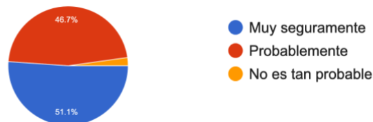
Figura 3. Perspectivas de uso de la guía

Finalmente, las sugerencias incluyen un trabajo más profundo de capacitación y crear alianzas estratégicas para la implementación de la guía.