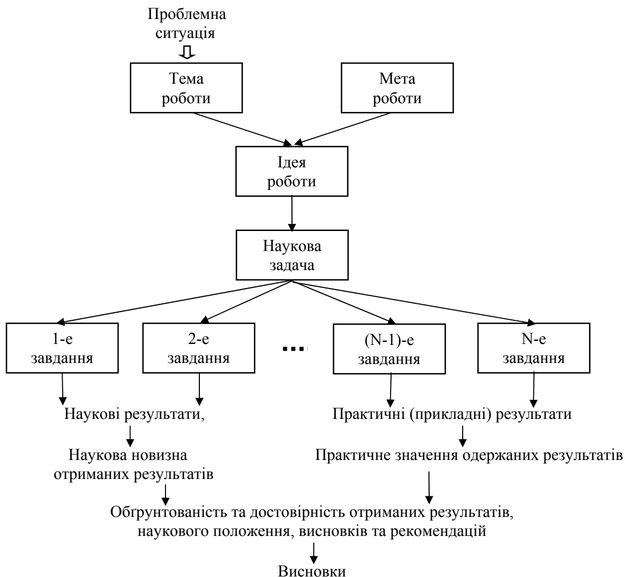
Рис. 1.1. Структура основних логічних складових дипломної роботи.

Характерний зв'язок теми роботи з основними логічними складовими дипломної роботи показаний на рис. 1.1.