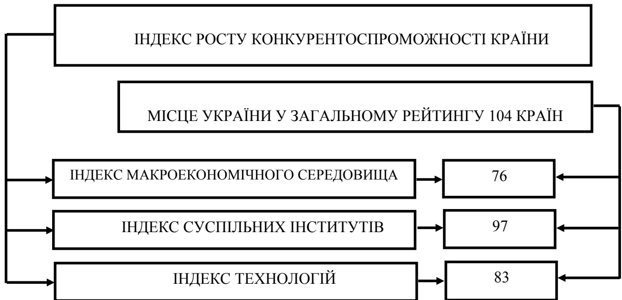
Рис. 1 – Індекс росту конкурентоспроможності України

Нажаль, сьогодні Україна займає останні місця в цьому рейтингу по всім показникам, однак, результати досліджень показали, що найбільшою перешкодою на шляху росту конкурентоспроможності нашої країни є низька якість суспільних інститутів (індекс суспільних інститутів характеризує рівень корупції державних органів, злочинності та захищеності прав громадян). Країна охоплена епідемією корупції та бюрократизму, результат яких – неефективність функціонування економіки і відповідне зниження потенціалу росту України у майбутньому.