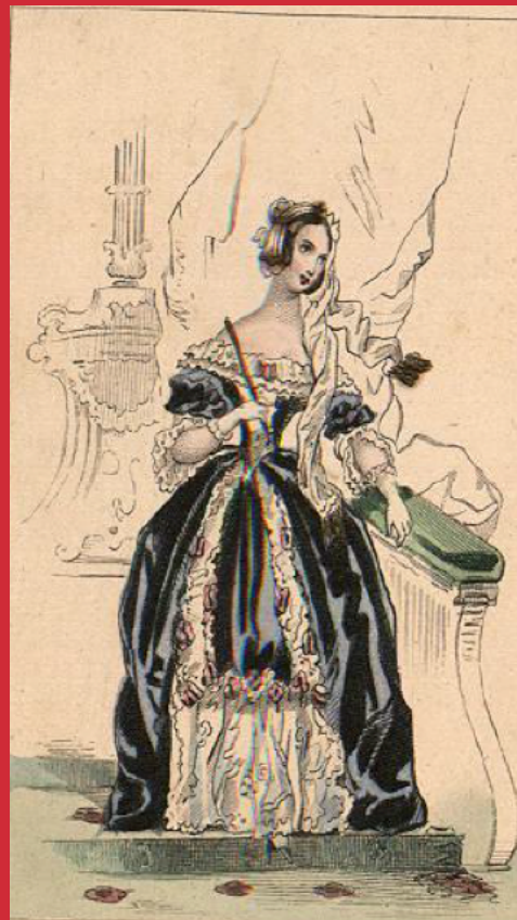
“Trage de tertulia”,

por su resguardo en una hemeroteca, hasta el rescate en una plataforma digital en el siglo XXI. En conjunto, CD y estudio, están en el punto justo entre lo analógico y lo digital, se acompañan dos formas distintas de impresión de resguardo, con procesos y mecanismos de lectura distintos. El doble formato que nos propone la UAM en esta publicación permite que se socialice la información, dado que se multiplican las posibles lecturas, se democratiza el archivo tradicional, así más estudiosos y curiosos pueden conocer un impreso que surgió hace casi dos siglos y tener el