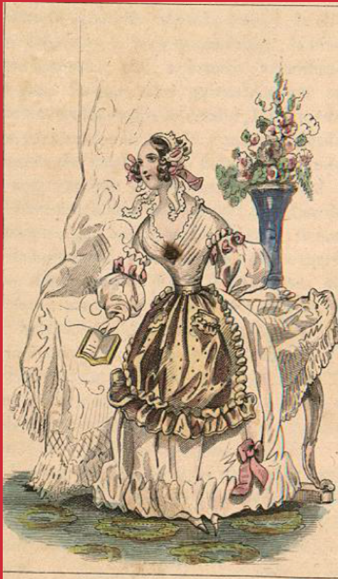
“Trage de mañana”,

un clásico problema de documentos extraíbles de un objeto como éste, si no se mantiene unidos a la pasta, su separación será más accesible y la pérdida definitiva.