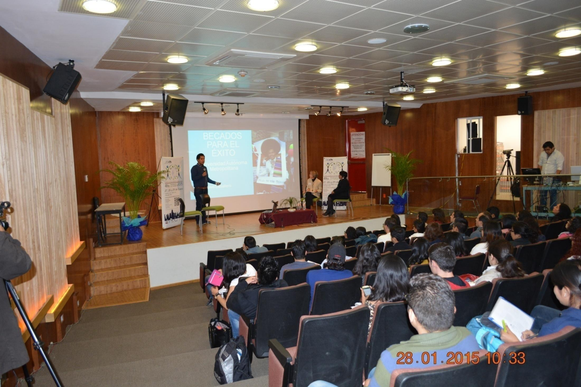
Becados para el éxito. Fundación Azteca, Movilidad/Santander