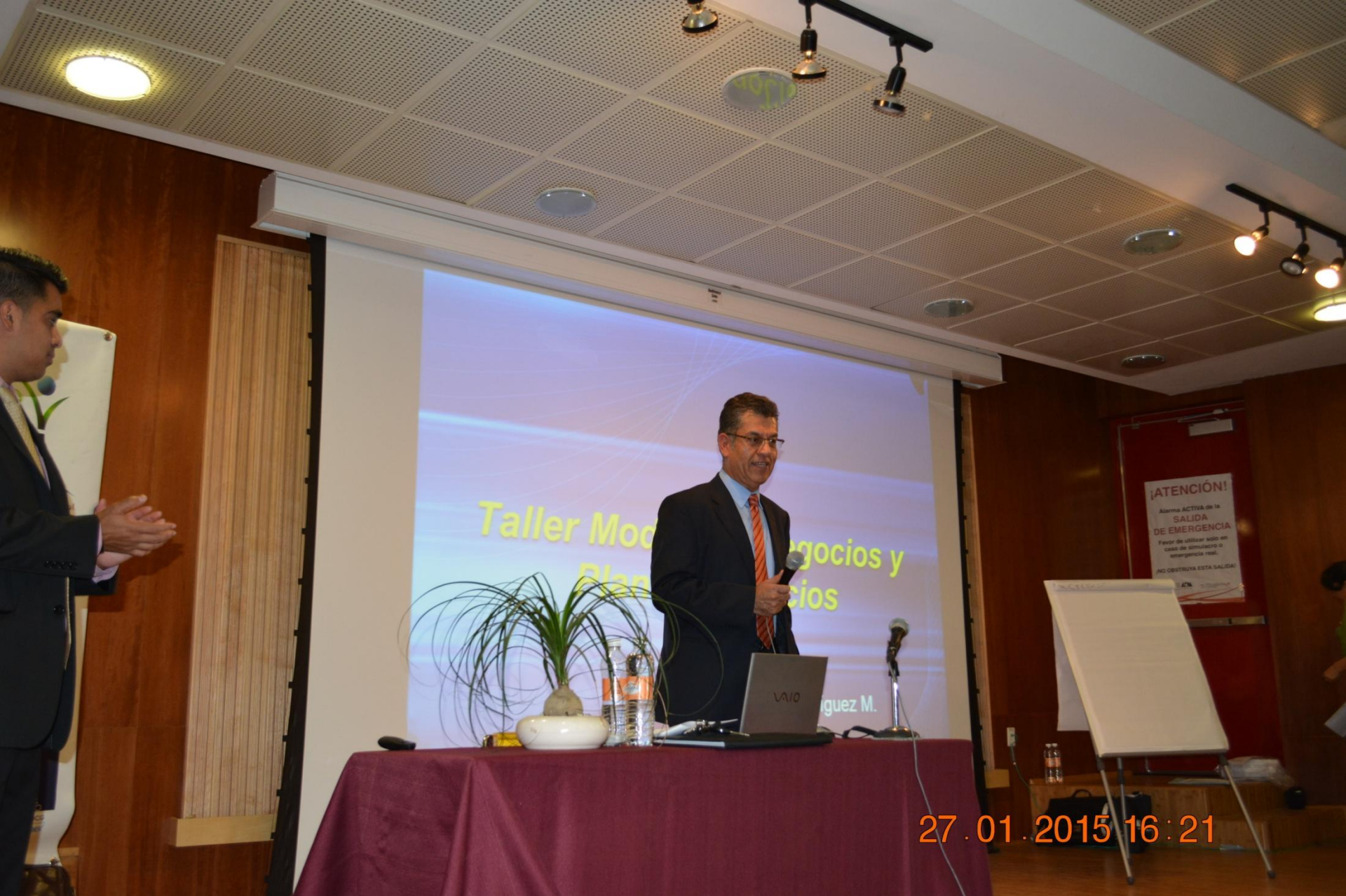
La Importancia del Modelo de Negocio y Plan de Negocio (curso)