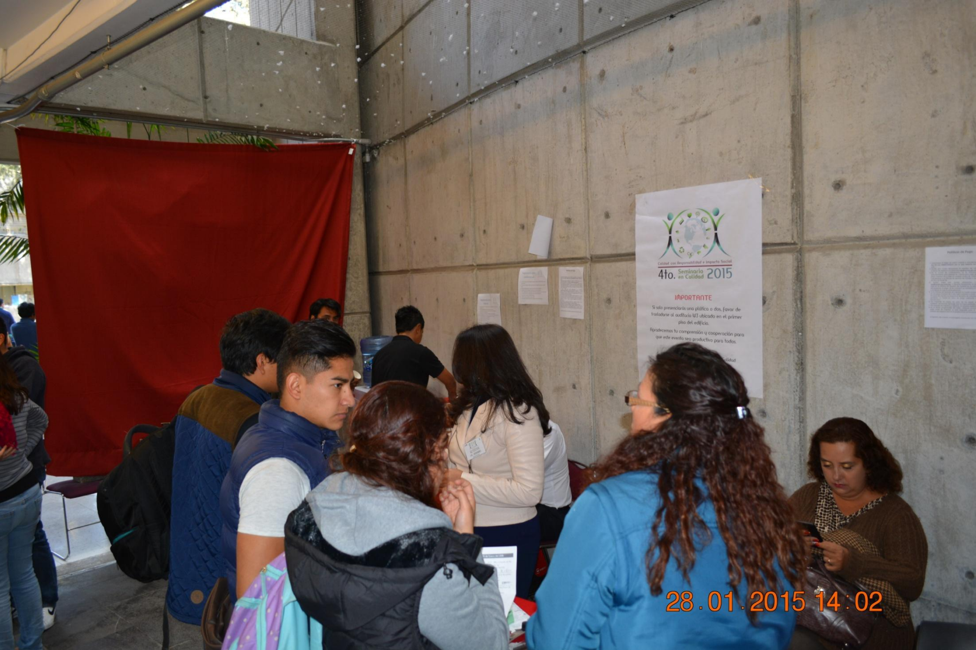
4° Seminario en Calidad 2015 – Inscripción y registro