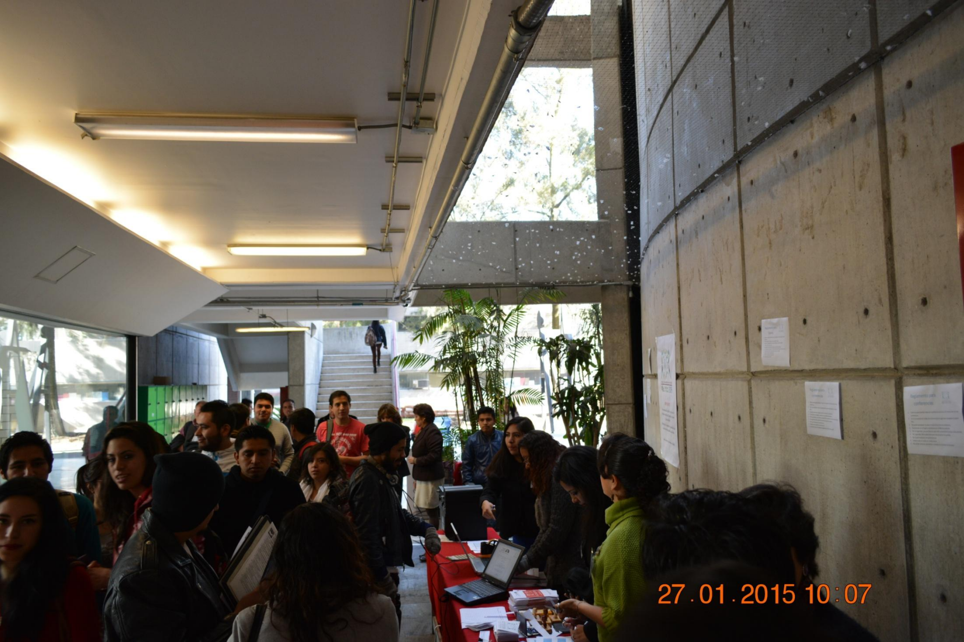
4° Seminario en Calidad 2015 – Inscripción y registro