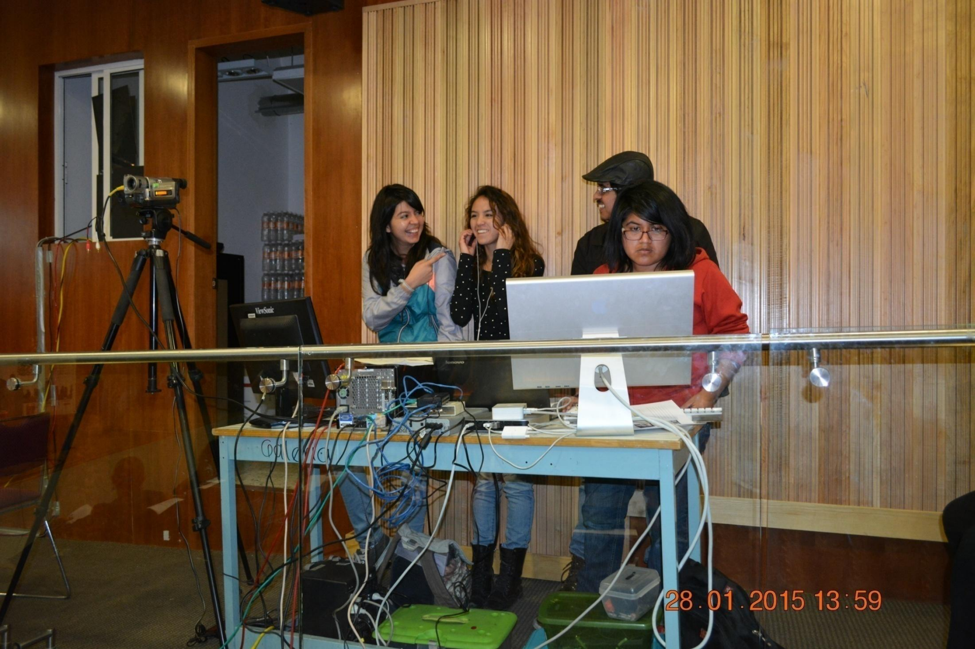
Alumnos de Servicio Social de CYAD-TV / UAM Azcapotzalco apoyando en la grabación y transmisión del 4º Seminario en Calidad 2015. Calidad con Responsabilidad e Impacto Social.