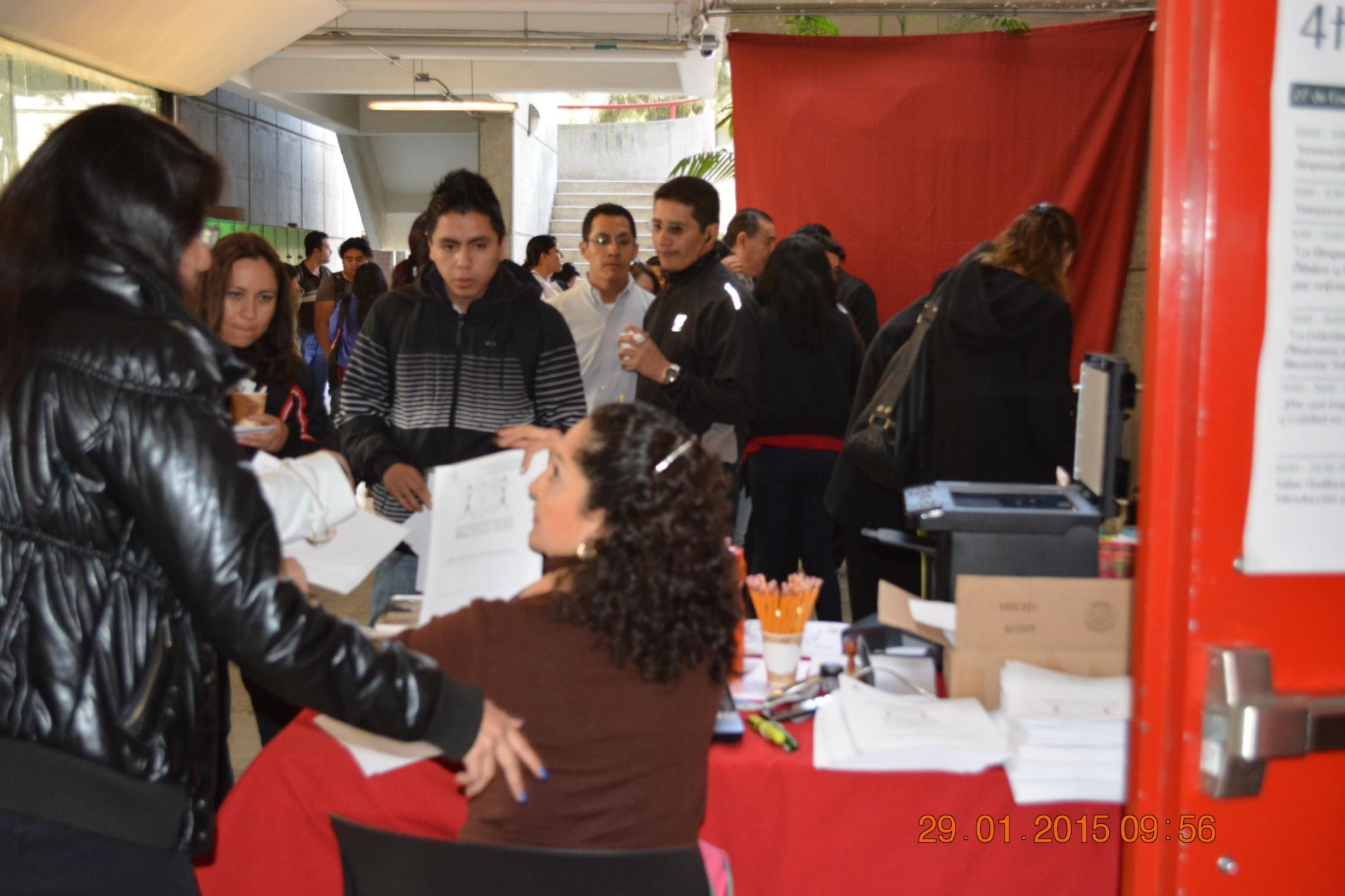
4° Seminario en Calidad 2015 – Inscripción y registro