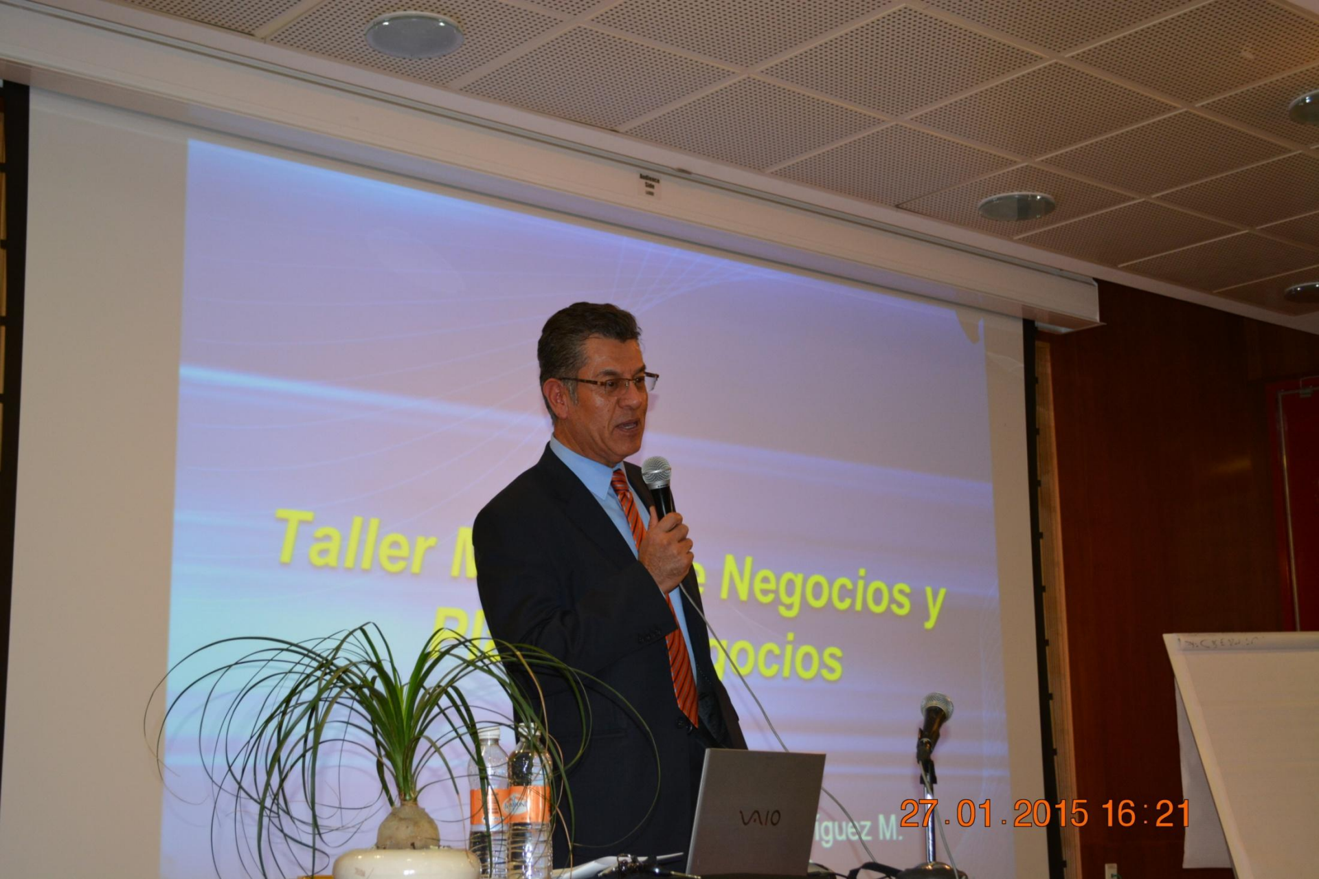
La Importancia del Modelo de Negocio y Plan de Negocio (curso)