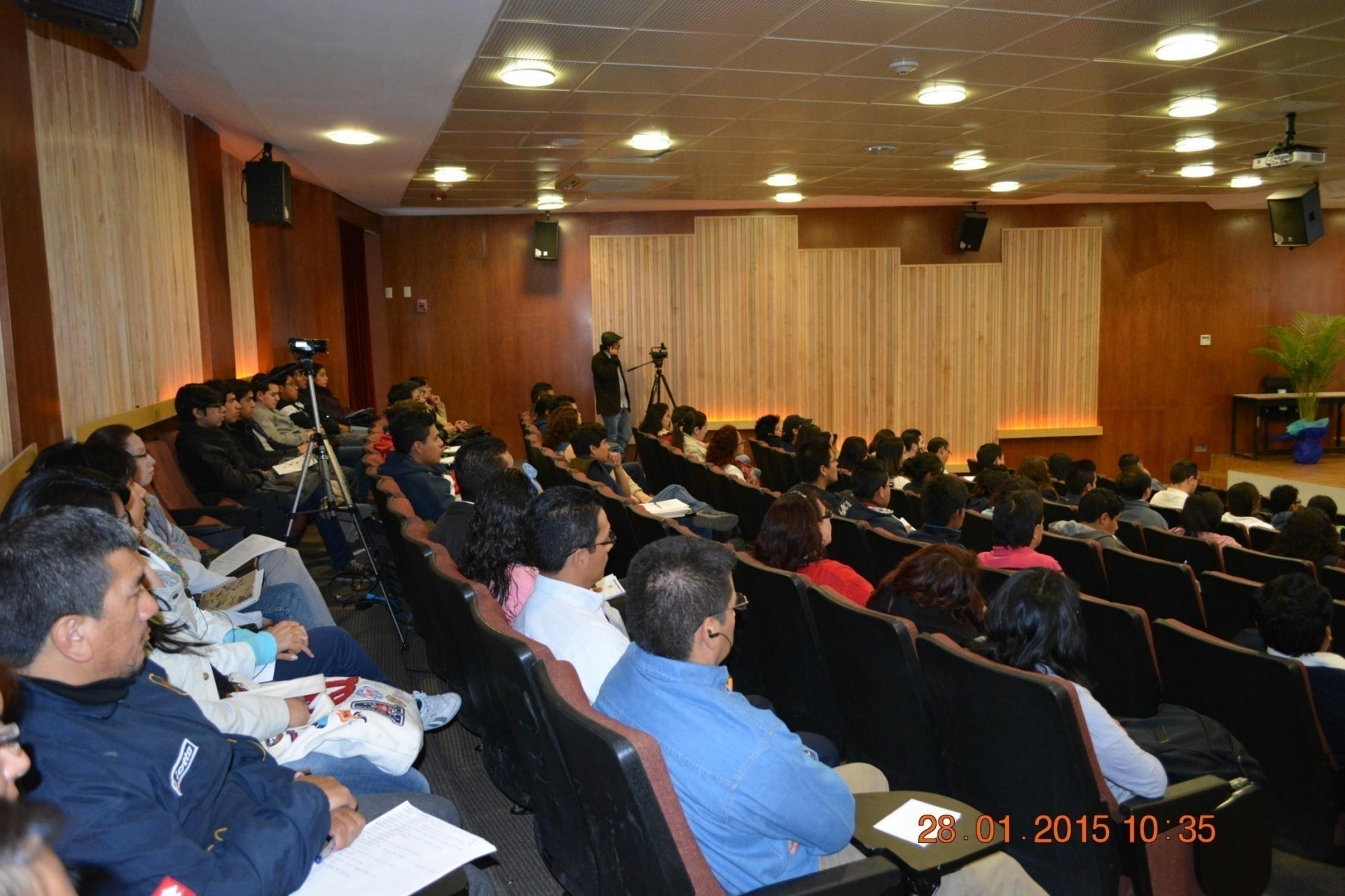
Asistentes a la conferencia: Becados para el éxito. Fundación Azteca, Movilidad/Santander