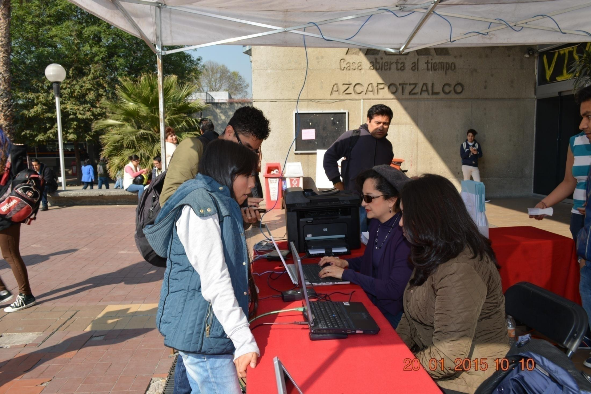
4° Seminario en Calidad 2015 – Inscripción y registro