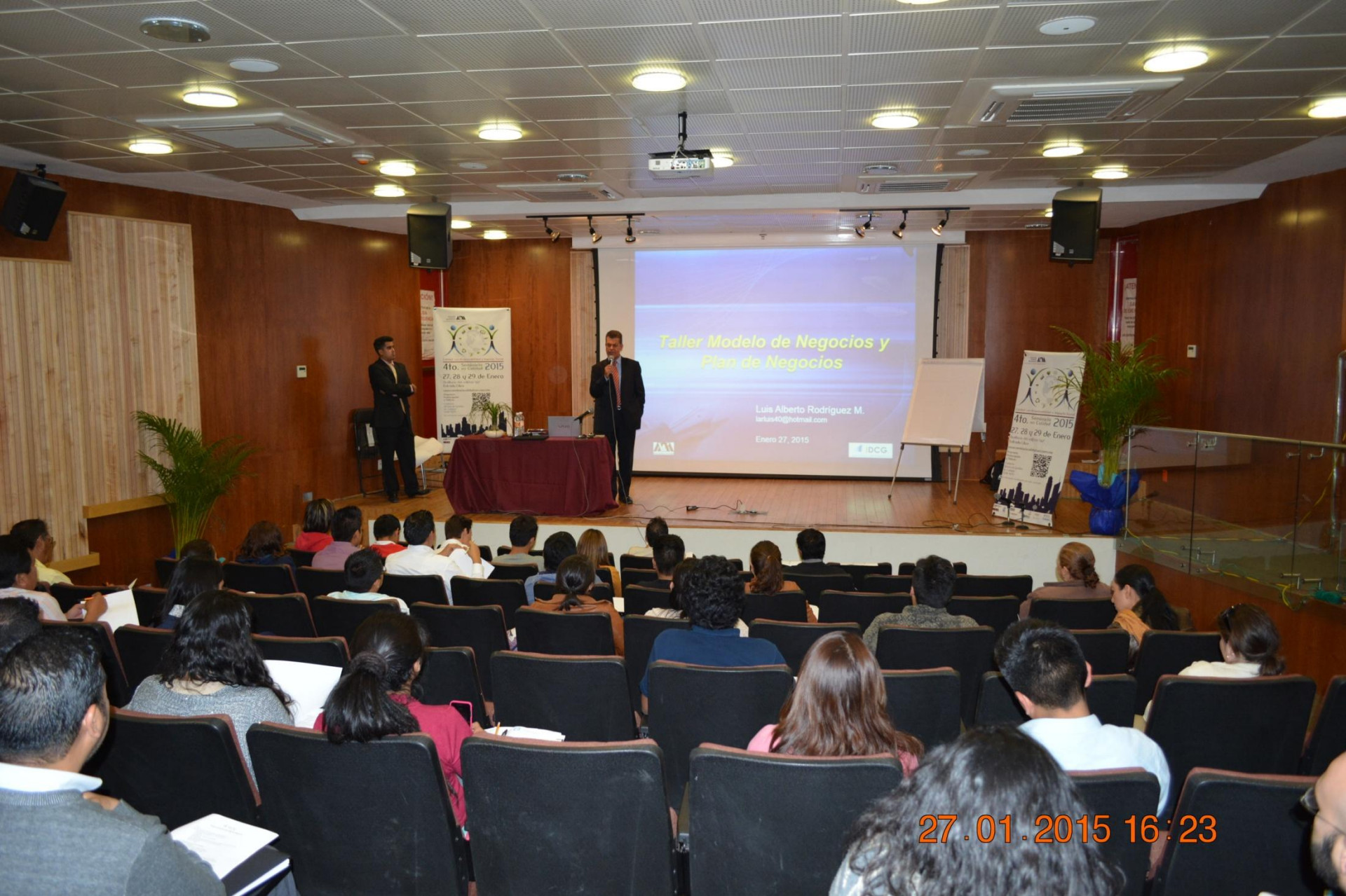
La Importancia del Modelo de Negocio y Plan de Negocio (curso)