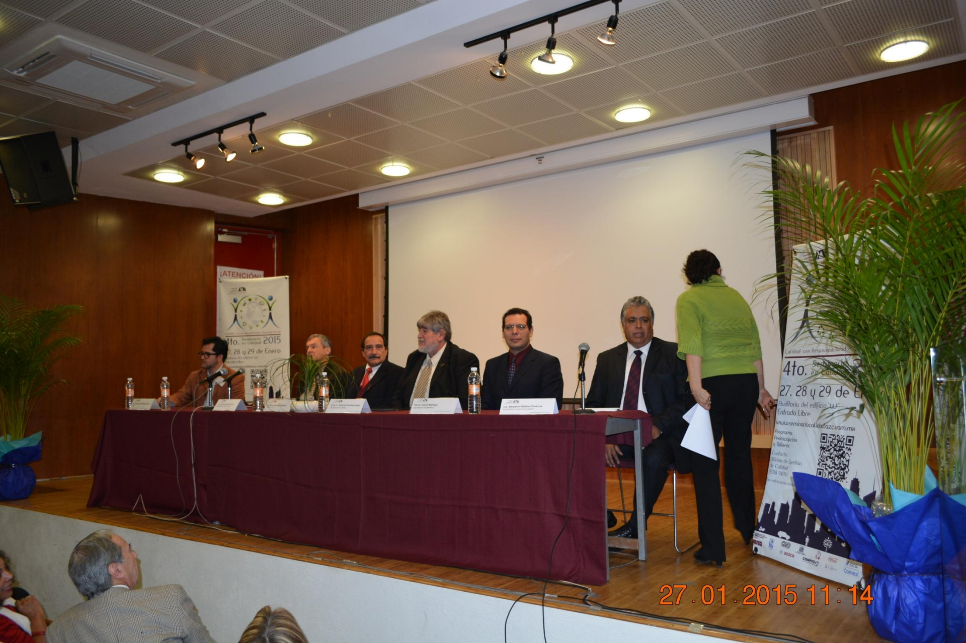
4° Seminario en Calidad 2015 – Inauguración