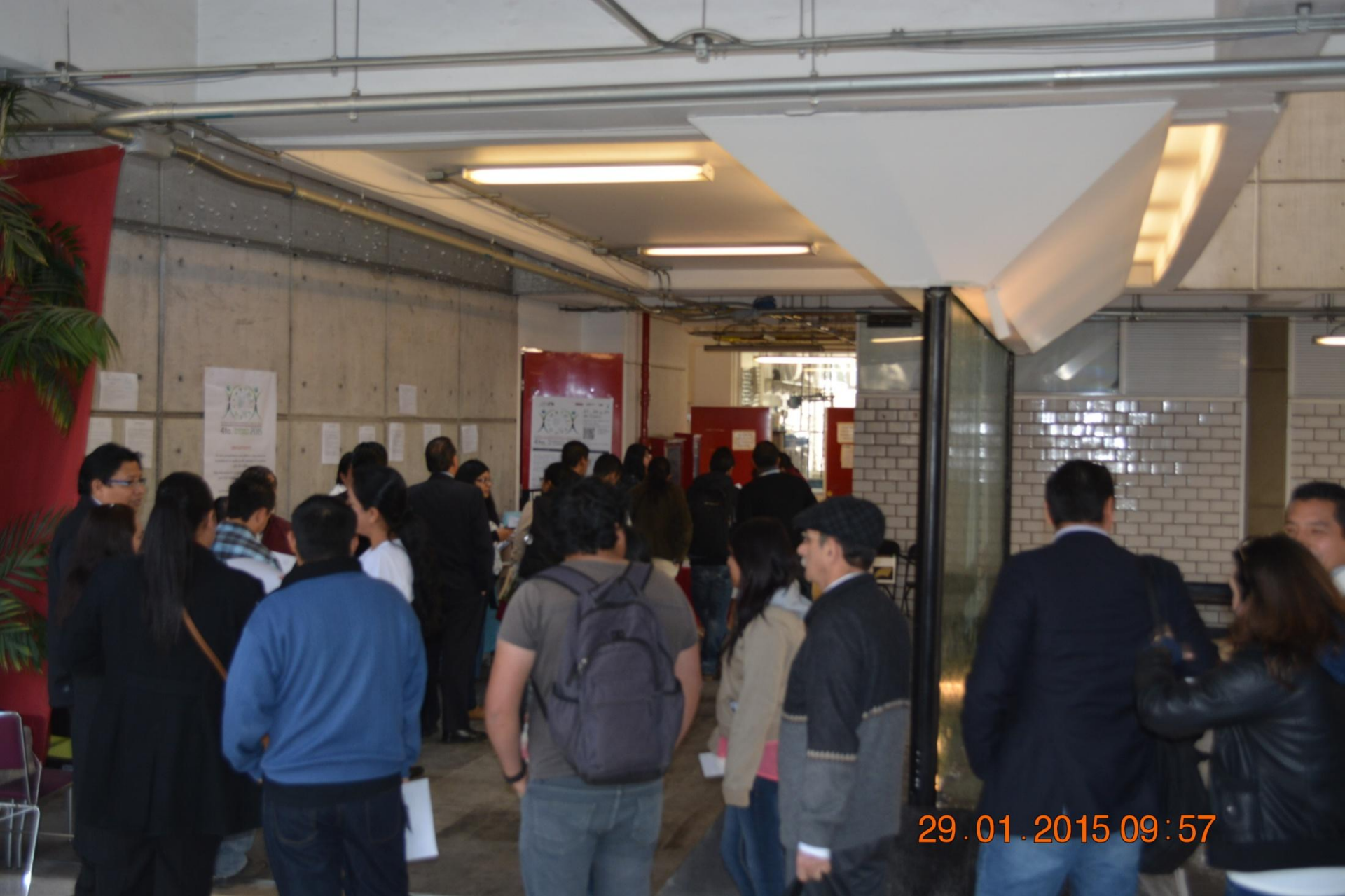
4° Seminario en Calidad 2015 – Inscripción y registro