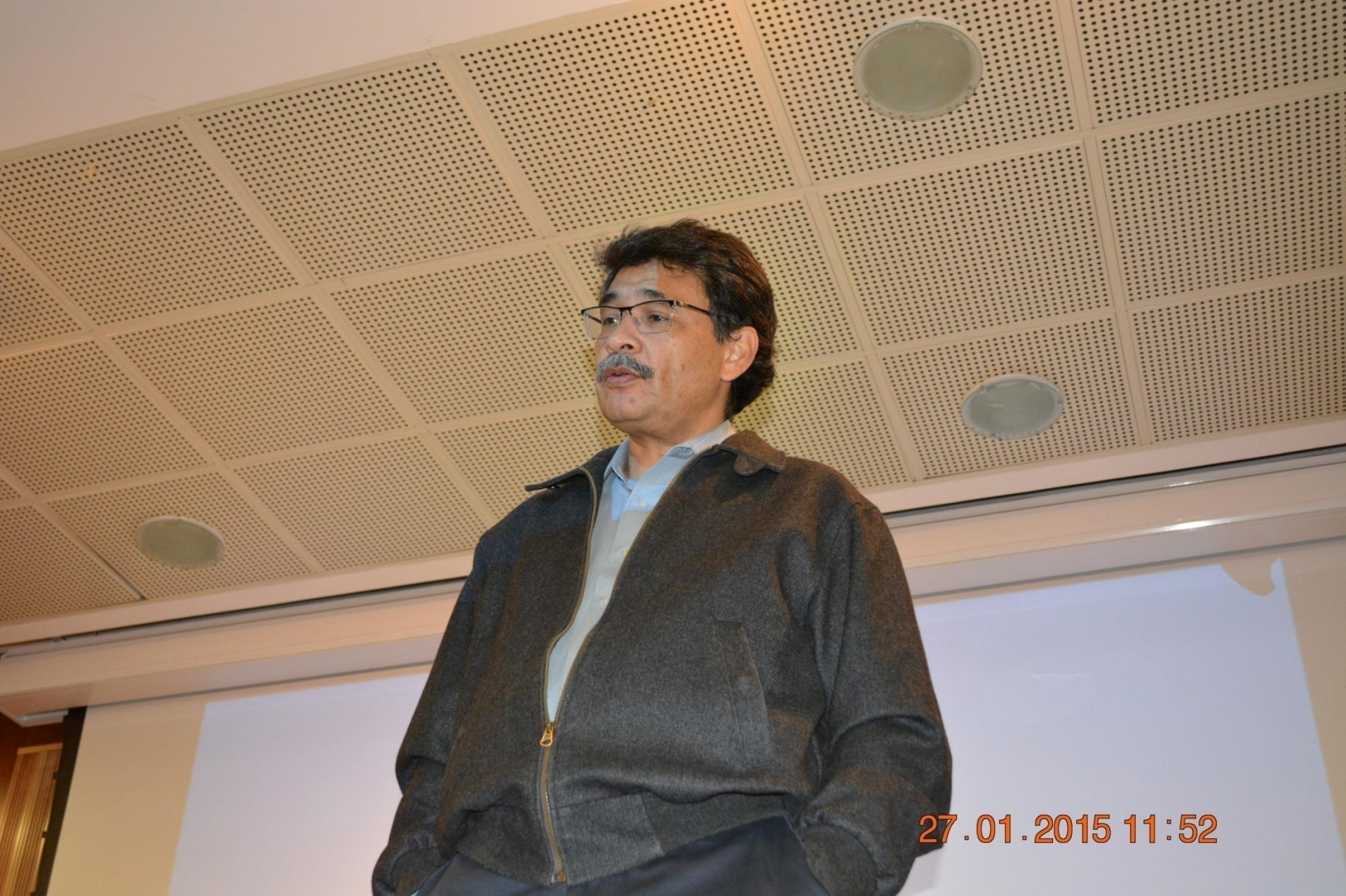
Soc. Germán Castro Ibarra La felicidad de los mexicanos: medición del bienestar subjetivo / INEGI