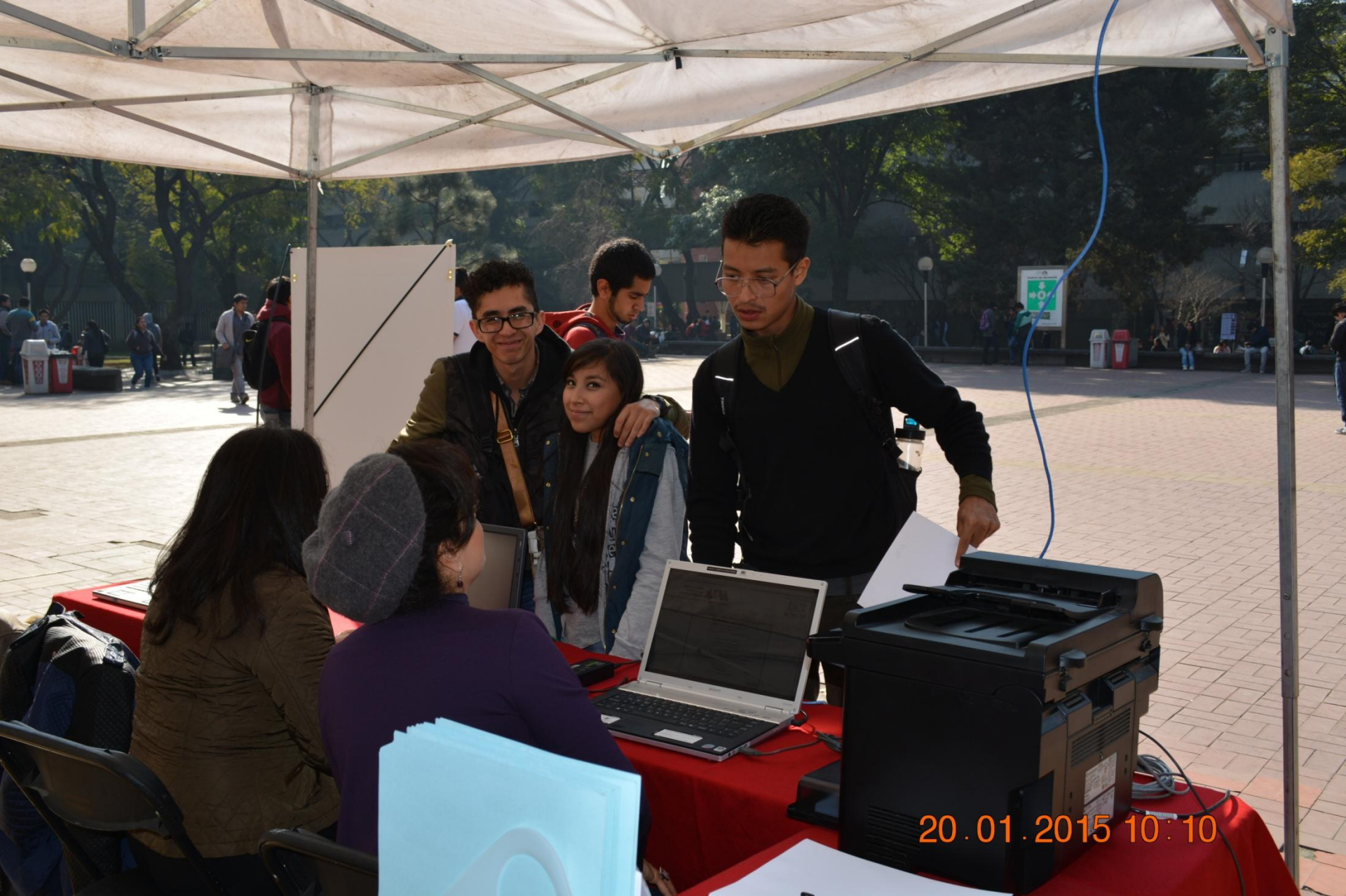
4° Seminario en Calidad 2015 – Inscripción y registro