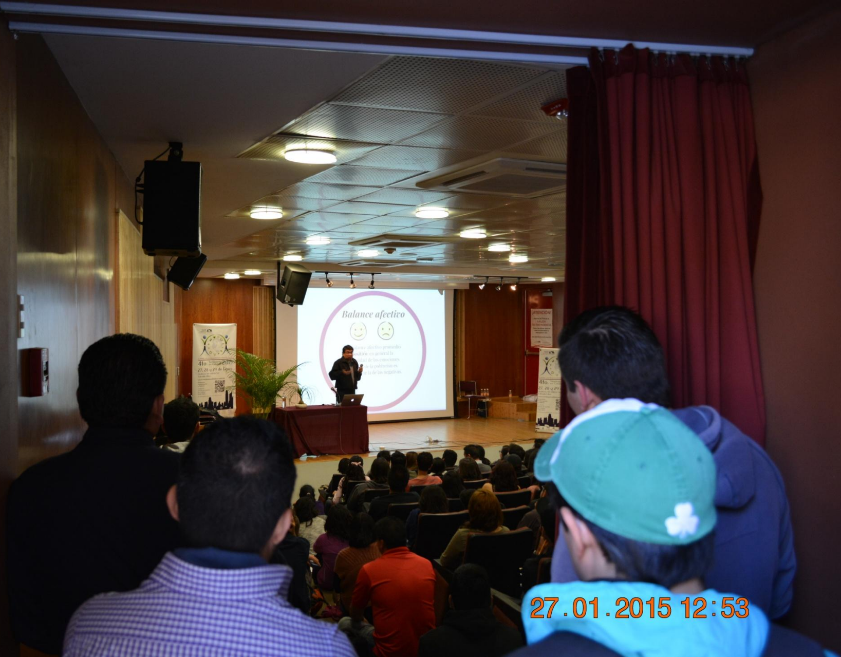
La felicidad de los mexicanos: medición del bienestar subjetivo / Soc. Germán Castro Ibarra, INEGI.