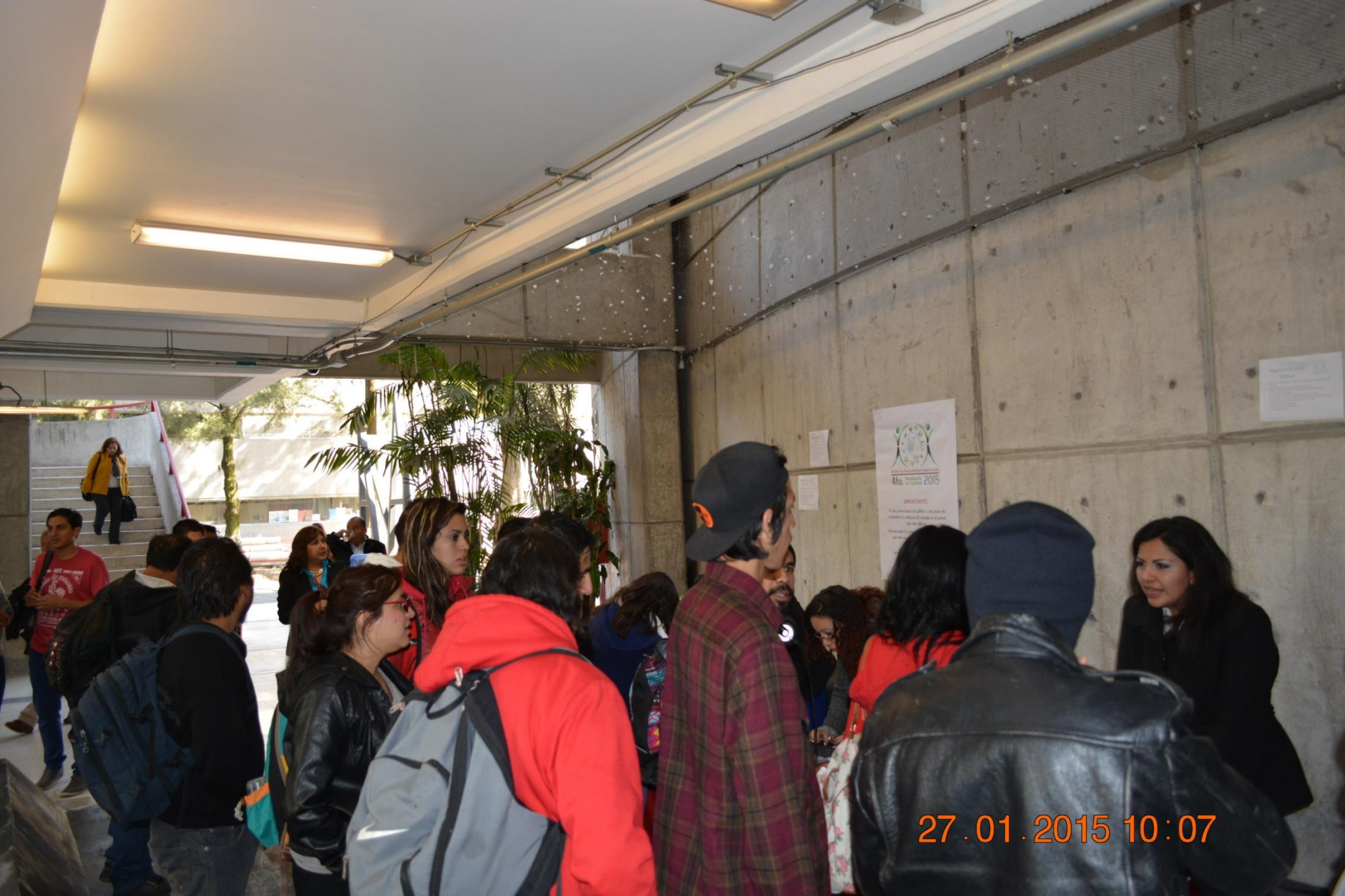
4° Seminario en Calidad 2015 – Inscripción y registro