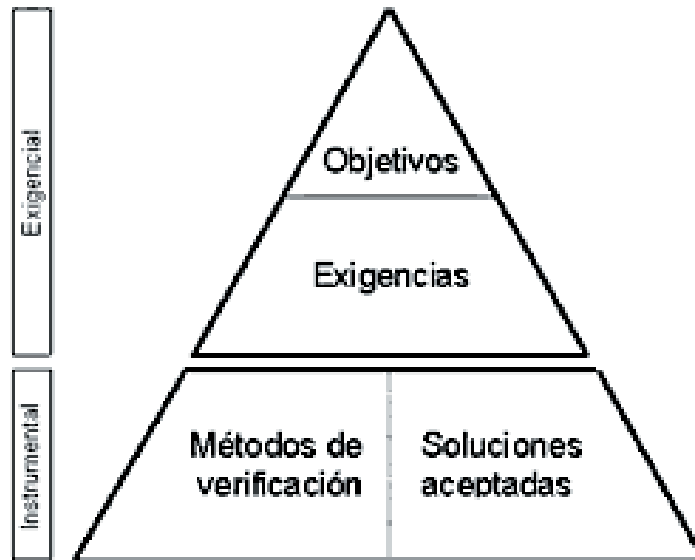
Figura 1. Estructura jerárquica del Código Técnico de la Edificación

Las exigencias son las condiciones específicas en que se debe verificar el diseño del edificio, sus sistemas constructivos y los productos que lo componen para cumplir los objetivos establecidos. Su contenido tendrá un carácter técnico y se expresará generalmente de forma cualitativa, siendo en algunos casos cuantitativa.