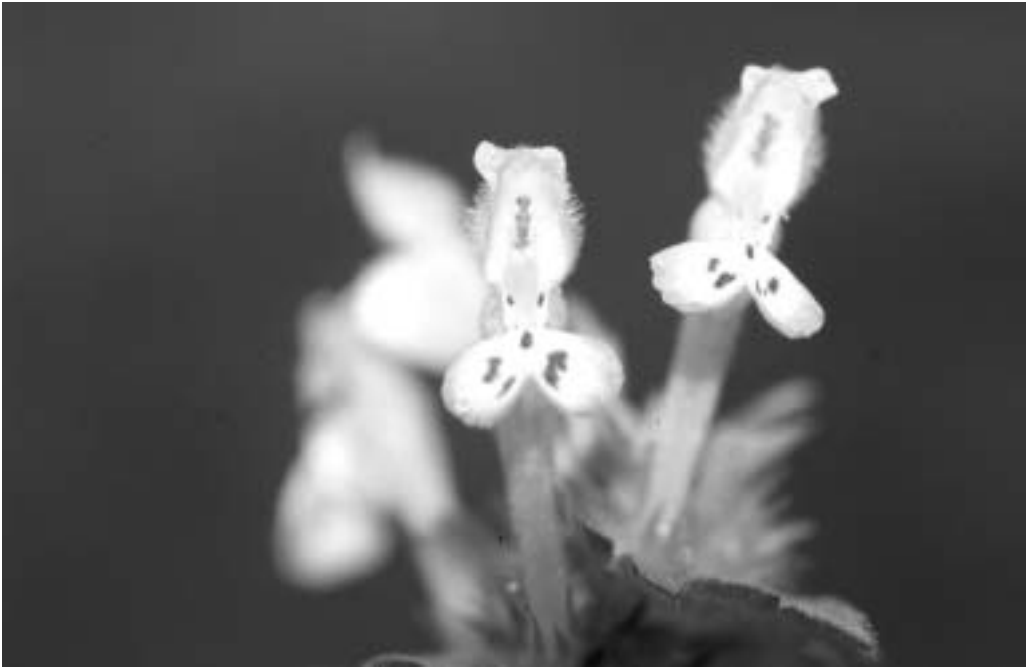
Figura 2. Lamium gevorense , Valencia de Alcántara, Cáceres

melojo ( Quercus pyrenaica Wild.), de pinares de Pinus pinaster Aiton, pastizales, márgenes de ríos y arroyos, frecuentemente subruderal en herbazales nitrófilos, junto a muros graníticos, márgenes de caminos y de cultivos, raramente arvense en plantaciones de olivar. Preferentemente vive sobre suelos poco evolucionados (Leptosoles dídtricos), sobre rocas graníticas, cuarcitas y pizarras.