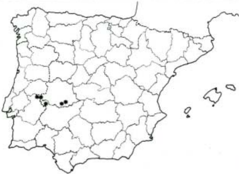
Figura 3. Lamium gevorense , Mapa de distribución.

diferencias entre L. gevorense y L. amplexicaule , L. hybridum y L. purpureum es probable, también, que exista algún tipo de relación entre L. gevorense y alguna o algunas de las demás especies.