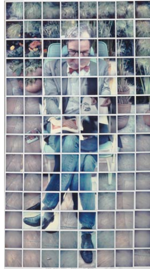
Aplicación del mismo concepto cubista David Hockney 1982 (foto montaje).

Esta nueva conformación de sentido se descubre a través de la différance . Derrida nos invita o bien nos desafía a “inventar en tu propio lenguaje si tú quieres o puedes entender el mío; inventa si tú puedes o quieres aquello para dar a mi lenguaje un entendimiento” 47 . Es decir, en esta línea de pensamiento derridiana, a la obra de arte o diseño es posible sumar, por un lado, el trabajo innovador realizado y, por otro, a verbalizar lo hecho en este sentido de actitud de ruptura o irrupción. Si no es posible por mí, entonces será por tí.