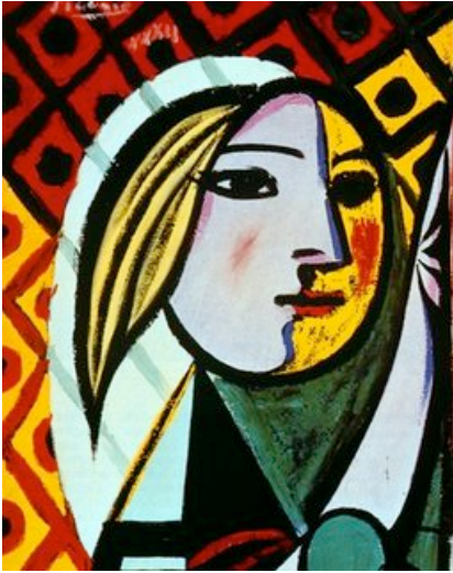
Aplicación del concepto cubista puro Pablo Picasso 1932 (detalle).