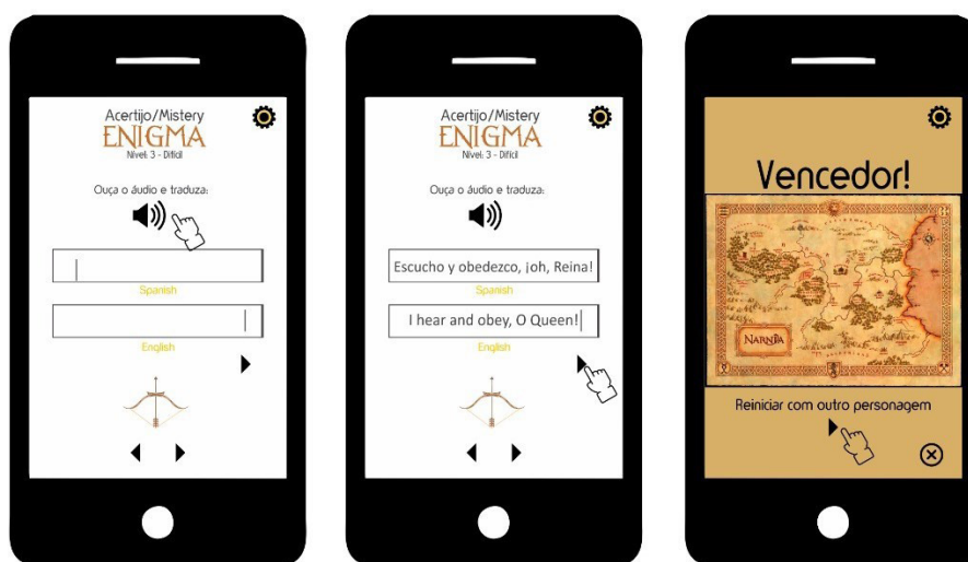
Imagen 3: Tercer etapa del juego: UFs del Cuadro 2

Ejemplos como los presentados en este núcleo y son los que menos muestran variación y permiten elaborar una acción dentro del juego que sea puntual y asertiva, lo que consideramos ser pertinente en la etapa final, cuando es necesario restringir las opciones del traductor en formación para que termine la trayectoria en Narnia.