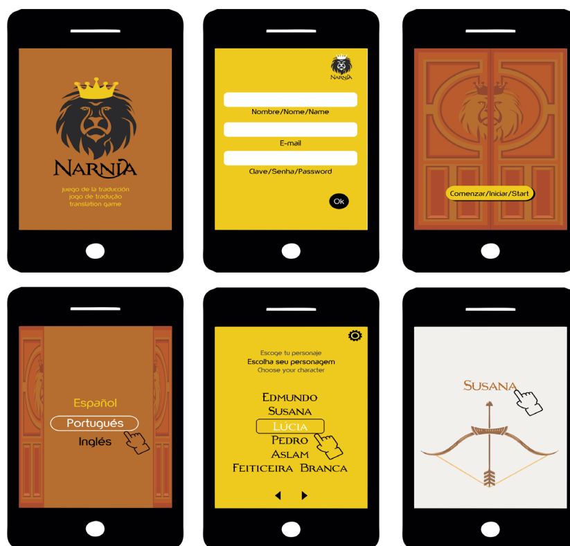
Imagen 1: Pantallas de apertura y de elección de los personajes