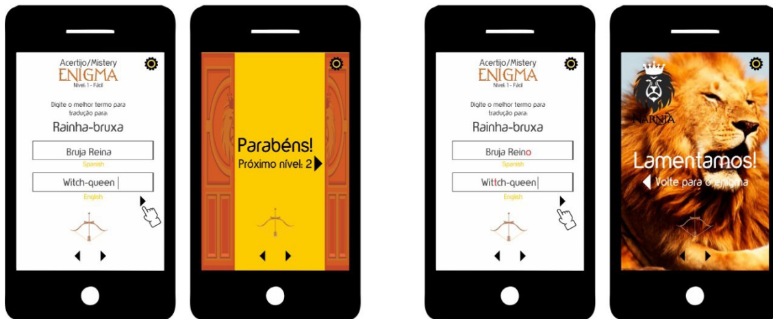
Imagen 2: Segunda etapa del juego: UFs del Cuadro 3