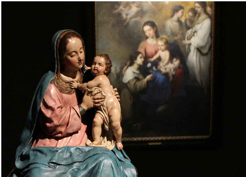
1. En primer plano, Virgen con el Niño , de Luisa Roldán (1699, Convento de las Teresas, Sevilla). Al fondo, La Virgen y el Niño con Santa Rosa de Viterbo , de Murillo (ca. 1670, Museo Thyssen-Bornemisza, Madrid).

de conocer a la escultora de cámara de Carlos II durante su etapa sevillana. Queda para la memoria del público que acudió a la exposición la comparación establecida por el comisario entre diversas Vírgenes con el Niño de Murillo con el barro del mismo tema conservado en el convento de Las Teresas de Sevilla [1].