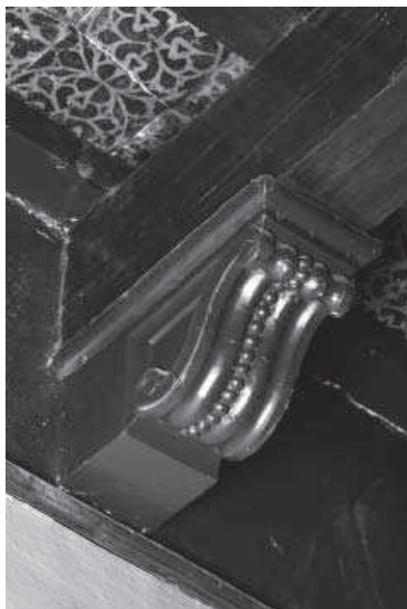
2. Detalle de un can o ménsula. Alfarje del zaguán.