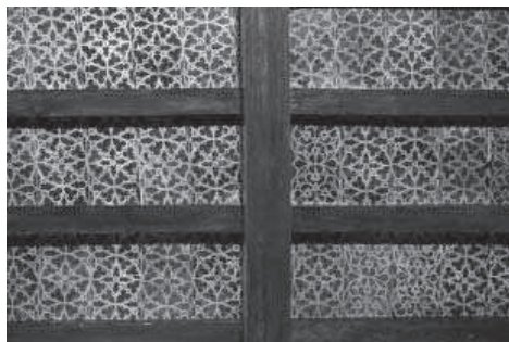
3. Motivos estarcidos del alfarje del zaguán..

balaustres en los extremos y decoración frontal con molduras y, en el eje, collarino, como sucede en este caso, u otros motivos.