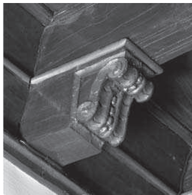
6. Detalle de una ménsula de cartela. Techumbre de la Sala V.

renacentista. Su relación con el hospital se ha establecido mediante la atribución de la portada de su iglesia a Hernán Ruiz.