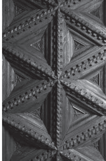
9. Detalle del artesonado de la Sala I.