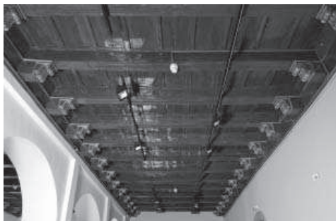
5. Techumbre de la Sala V.