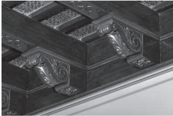
7. Techumbre realizada entre 1945 y 1949 para la Sala VI.

resto del edificio. Dejando aquí patente que se trata de techumbres completamente nuevas, hemos de señalar que la fuente de inspiración para su realización estuvo dentro del propio edificio. Efectivamente, para cerrar las distintas naves en que está compartimentada la sala VI se empleó el mismo tipo de techumbre en cada una de aquéllas, combinando la estructura de un alfarje de dos órdenes de vigas, más el ladrillo por tabla [7]. Las jácenas descansan sobre ménsulas de cartela –todas nuevas– que en este caso figuran decoradas con hoja de acanto y roseta en la base del can, además de llevar los consabidos balaustres; tipo de can frecuente en casas palacio a partir del XVI avanzado y que debieron copiar de algún modelo cercano. Los papos de las vigas añaden en este caso la peculiaridad de aparecer con encintado, motivo que en realidad está repitiendo el que se encuentra en una techumbre de la contigua casa de los Romero de Torres. Respecto a los estarcidos que ornamentan los ladrillos, optaron por copiar algo más toscamente los motivos que se ven en el zaguán.