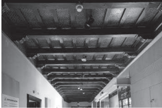
1. Alfarje del zaguán. (Foto: Álvaro Holgado).

museo fue recuperada por Velázquez Bosco 8 , como se percibe en algunos pilares y capiteles de nueva factura. Fue el hallazgo de vestigios de la primitiva arquería lo que le dio pie para su intervención, la última que llevó a cabo antes de fallecer en 1923. Además añadió azulejos sevillanos 9 y una reja para la nueva puerta que abrió. Su muerte hizo que su discípulo, Francisco Javier de Luque, retomara las obras mediante la intervención en planta alta realizando el segundo cuerpo de fachada, para lo cual se inspiró en los vestigios aparecidos bajo el revoco del piso inferior 10 .