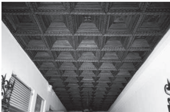
10. Artesonado de la galería de entrada desde la Plaza del Potro al Museo de Bellas Artes y al Julio Romero de Torres. Procede del convento de San Francisco de Lucena. (Foto: Álvaro Holgado).

obligaba a enviar al Museo de Bellas Artes el artesonado de casetones triangulares que custodiaban los franciscanos en su convento tras su intento frustrado de venta 32 .