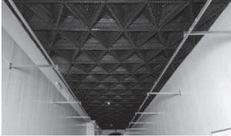
8. Artesonado de la Sala I procedente del convento de San Francisco de Lucena. (Foto: Álvaro Holgado).

artesonados procedentes del convento de San Francisco de Lucena o bien imitaciones de las techumbres ya existentes en el hospital durante las obras de reforma dirigidas por Luque que estuvieron concluidas en 1930 26 . Todo parece indicar, por tanto, que entonces se imitaron los modelos originales para cubrir aquellos espacios que no tenían una cubierta en sintonía o que fueron fruto de ampliación, con el fin de dar al edificio y las salas dedicadas a exposición museística un estilo homogéneo.