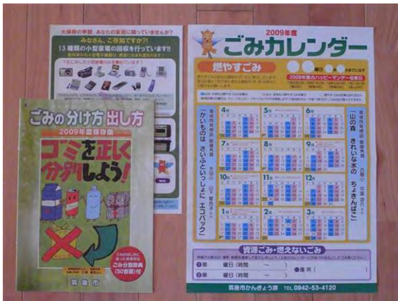
図4 筑後市におけるごみ分別情報