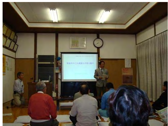
図3 ごみ減量のための市民説明会(筑後市)