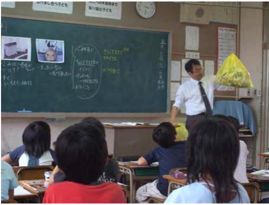
図6 ごみ分別授業の実施風景 (筑後市立水洗小学校)