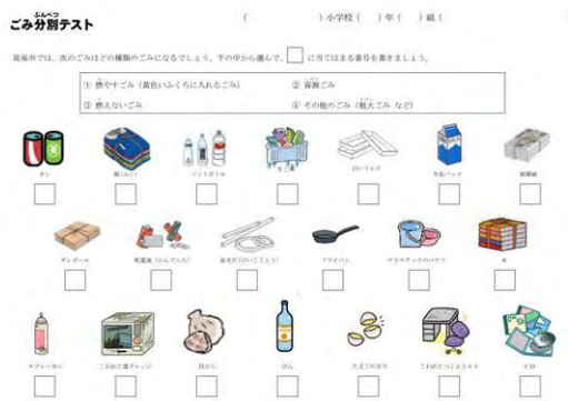
図7 ごみ分別テスト