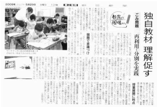
図8 ごみ分別授業の紹介記事 朝日新聞 2009年5月29日