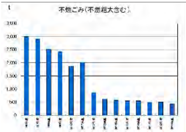
図1 筑後市における不燃ごみの推移