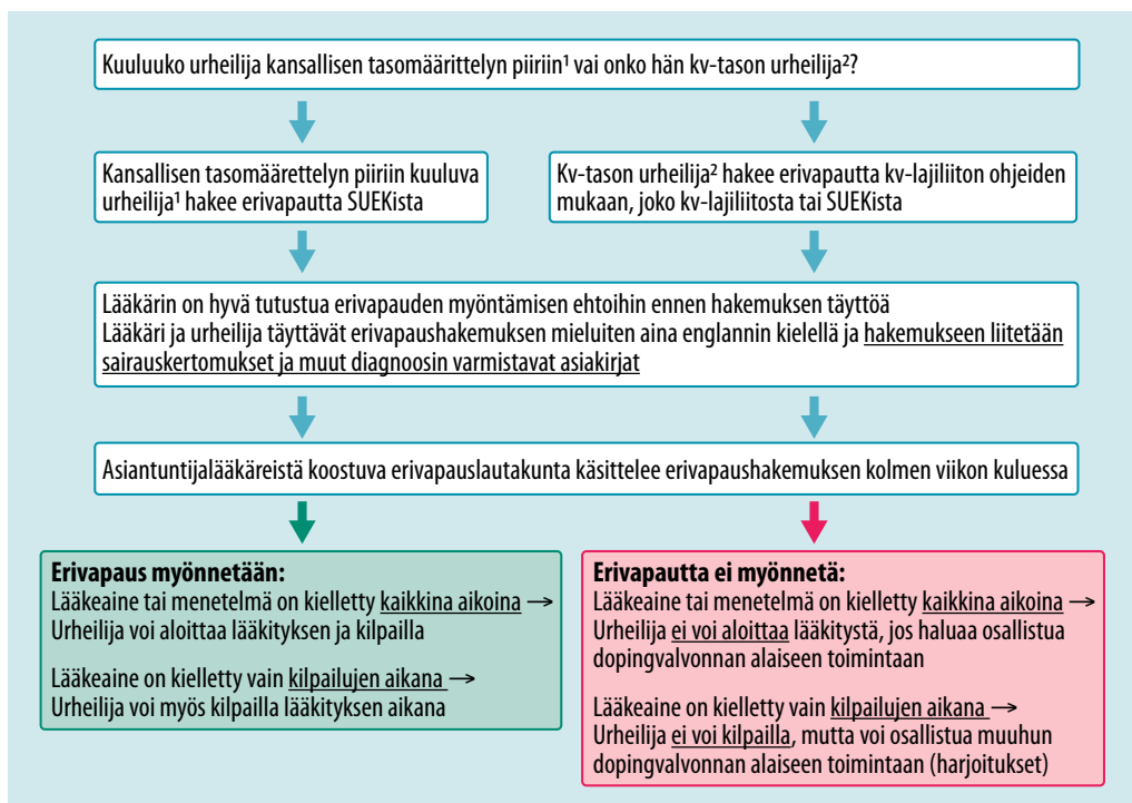
KUVA 2. Hakuprosessi erivapaudelle urheilussa kielletylle lääkeaineelle ja menetelmälle sekä prosessin lopputuloksen vaikutus osallistumiseen dopingvalvonnan alaiseen toimintaan.

1 SUEKin internetsivuilta (4) voi tarkistaa, kuuluuko urheilija kansallisen lajiokohtaisen tasomäärittelyn piiriin.