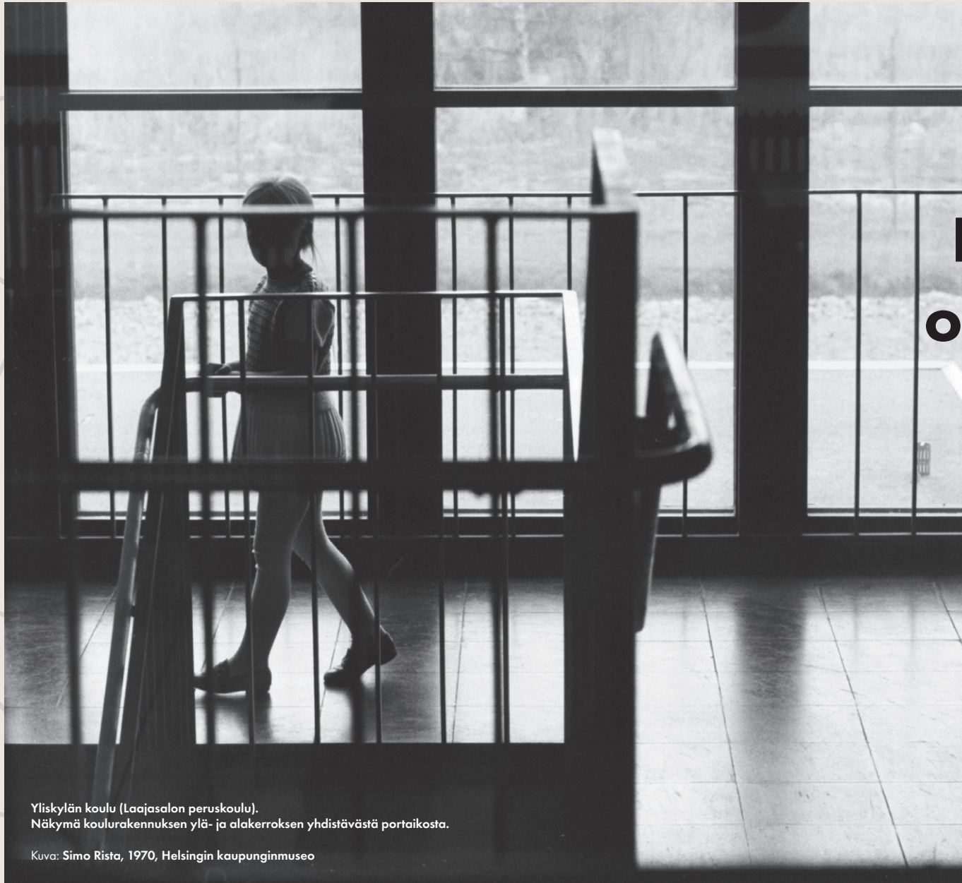
Yliskylän koulu (Laajasalon peruskoulu). Näkymä koulurakennuksen ylä- ja alakerran yhdistävästä portaikosta.

Kuva: Simo Rista, 1970, Helsingin kaupunginmuseo