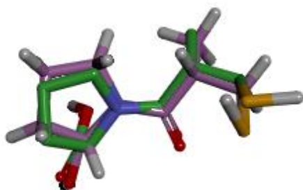
Gambar 1 Hasil Validasi Sisi Ikatan

Hasil validasi metode in silico dengan redocking native ligand protein target ACE dengan protein target ACE yang sudah dipreparasi didapatkan nilai RMSD 0,0 Å. Nilai RMSD menunjukkan jarak penyimpangan dari posisi ikatan native ligand dengan protein setelah didocking -kan terhadap posisi ikatan native ligand yang sebenarnya (Nauli, 2014). Nilai RMSD ini menunjukkan bahwa metode molekular docking yang digunakan sudah valid karena memiliki nilai RMSD dibawah 3 Å (Jain & Nicholls, 2008). Visualisasi interaksi native ligand dengan protein setelah didocking -kan terhadap posisi ikatan native ligand yang sebenarnya dapat dilihat pada Gambar 1.