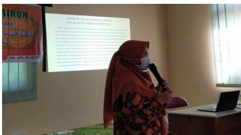
Gambar 3: Presentasi materi pelatihan

dilanjutkan dengan penjelasan mengenai manfaat alpukat bagi kesehatan manusia. Berikutnya, pemateri menjelaskan tentang alat dan bahan yang akan digunakan dalam mengolah alpukat menjadi kerupuk secara detail. Serta menjelaskan langkah-langkah pembuatan kerupuk alpukat secara lebih terperinci.