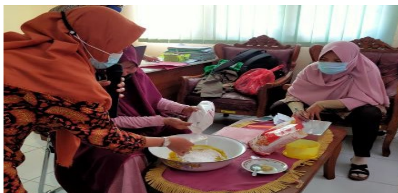
Gambar 5: Demonstrasi secara langsung pembuatan kerupuk alpukat

dicampurkan dengan semua bumbu yang telah tersedia, kemudian mencampurnya dengan tapioka dan terigu. Adonan yang telah jadi diperlihatkan secara langsung di depan peserta hingga cara mengukus adonan. Terakhir, cara memotong adonan yang telah dikukus. Setelah semua langkah-langkah diperlihatkan. Dipersilahkan kembali peserta untuk bertanya jika ada yang belum dipahami.