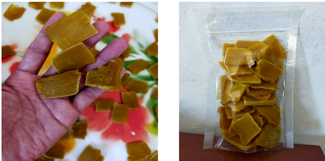
Gambar 5: Produk kerupuk alpukat

Berikut adalah gambar produk yang dihasilkan: