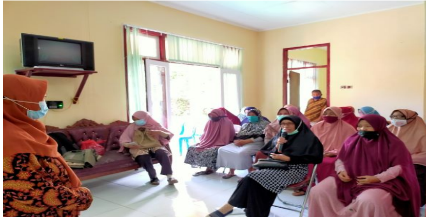
Gambar 4: Diskusi dengan peserta pelatihan

tapioka dan terigu nya. 3. Apakah kegiatan pelatihan seperti ini akan dapat dilaksanakan kembali, karena PKK memiliki program serupa untuk pemberdayaan ibu-ibu rumah tangga. Seluruh peserta begitu antusias dalam mengikuti penjelasan pemateri.