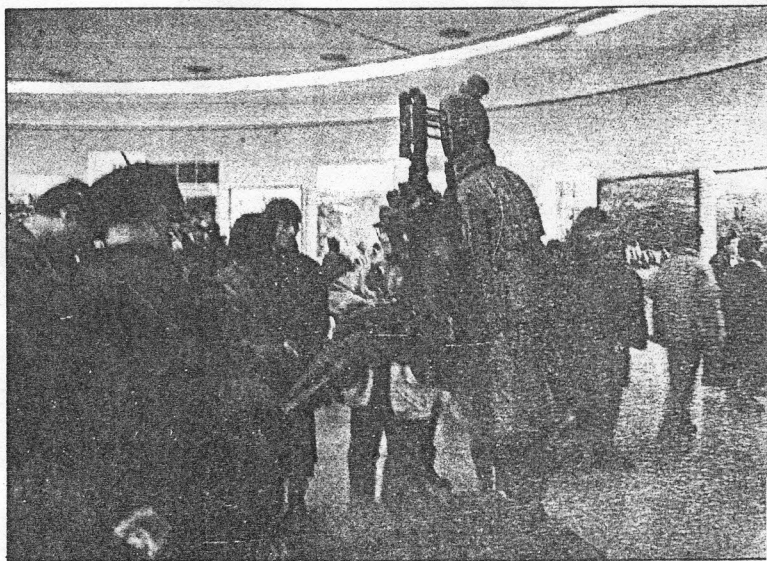
第八届全国美展优秀作品展如期在年底举行，尽管评价不一，佳作不多，仍不失为'94年度美术界的一件大事