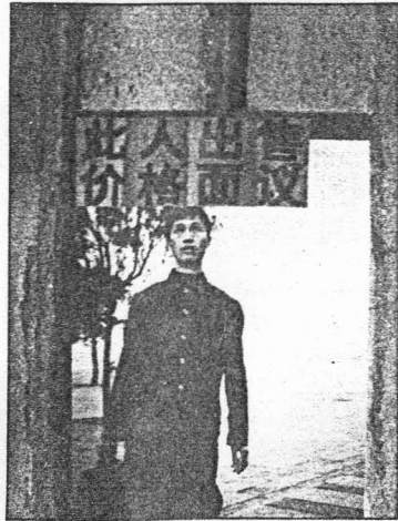
《此人出售·价格面议》是来自云南的职业艺术家朱发东在1994年全年实施的一项行为艺术。他认为我们正处在一个精神物质化的时代，艺术家必须对其作出反映