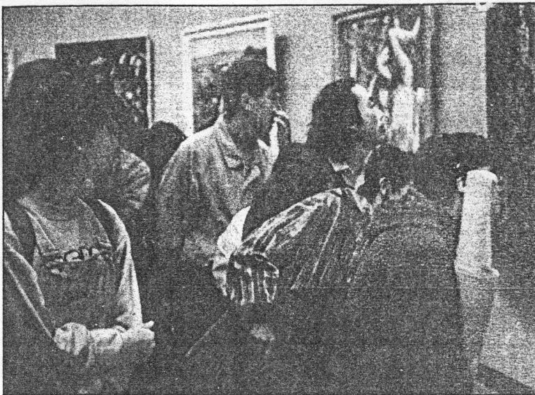
第二届中国油画展吸引着众多的艺术界同行和普通的艺术爱好者，中国油画艺术的发展潜力和人才资源不容置疑，1994年的油画界依然可算作丰收之年

回眸'94艺坛，略有荡气回肠、惊心动魄之感。无论是中国油画的火爆，还是艺评界的喧嚣；无论是行为艺术的躁动，还是权益纠纷的厮杀，都将是过眼云烟随风而逝。留下的只有对于历史的责任和对于未来的希冀。年终岁尾，在北京，5年一度的全国性大展——第八届全国美展优秀作品展拉开帷幕。全国各地的同行不畏寒冷汇聚京城。然而除了个别作品特别优秀外，令人鼓舞和激动的作品并不多见。与此同时，前卫艺术家的一次迎新聚会中，一块带着热气的大蛋糕被人当作“行为艺术”摔在人们的脸上。美术圈新的一个年度就是这样地开始了。他们似乎有意为1995年的艺坛留下一些困惑的伏笔和几多惊险的悬念。(L)