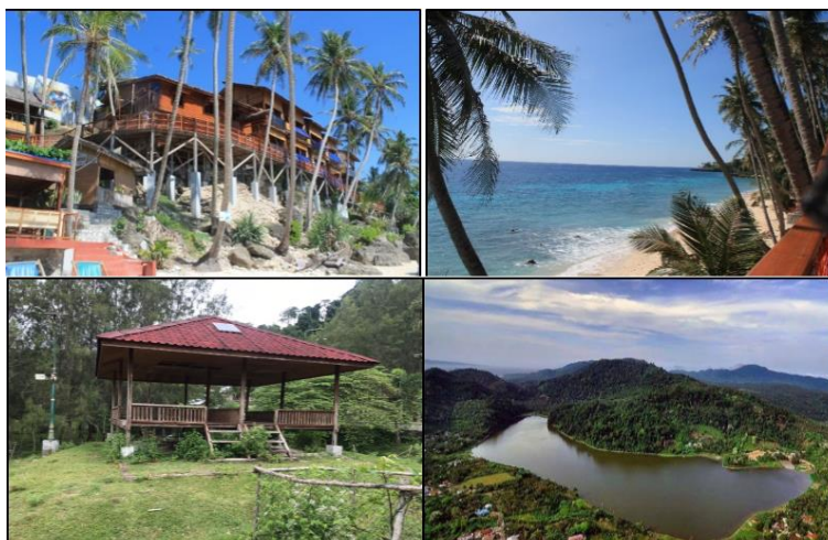
Gambar 2. Destinasi Wisata Pantai Sumur Tiga dan Danau Aneuk Laot

Tinggi dan rendahnya nilai yang di dapatkan pada destinasi wisata dikarenakan pengelolaan destinasi wisata yang berbed-beda. Destinasi wisata di Pulau Weh (Sabang) dikelola oleh berbagai pihak baik swasta, individu, masyarakat gampong (kelurahan), dan pemerintah. Penilaian destinasi wisata yang memiliki nilai paling tinggi dan kategori paling tinggi banyak yang dikelola oleh pihak individu dan swadaya masyarakat gampong (kelurahan), misalnya pantai sumur tiga dan pantai iboih, sedangkan yang memiliki nilai paling rendah dan kategori buruk dibangun oleh pemerintah daerah tetapi tidak terawat dengan baik. Untuk lebih jelasnya beberapa destinasi wisata di Pulau Weh (Sabang) dapat dilihat pada Gambar 2 berikut.