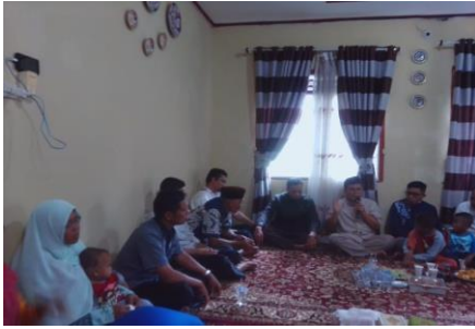
Gambar 1. Kegiatan Ceramah