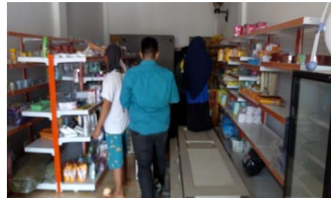
Gambar 4. Peserta memeriksa kelengkapan pebelan pada kemasan