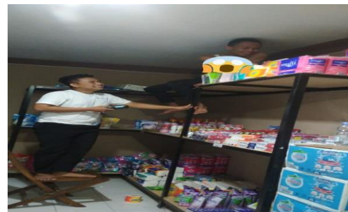
Gambar 5. Peserta menyusun barang berdasarkan kedaluwarsa

Tingkat pemahaman peserta terhadap seluruh materi yang disampaikan diaplikasikan melalui kegiatan prtaktek. Peserta dimintkan untuk menjelaskan informasi yang terdapat pada kemasan serta bagaimana menyusun barang di rak rak toko dan di dalam gudang sesuai dengan prinsip FIFO. Tahap ini mampu memperdalam dan memperjelas pemahaman dari materi yang disampaikan dalam kelas. Peserta mampu mempraktekkan hasil pembelajaran. Label yang terdapat pada kemasan menjadi perhatian saat penyusunan barang dan juga melaksanakan prinsip FIFO di rak rak toko. (gambar 3, 4 dan 5)