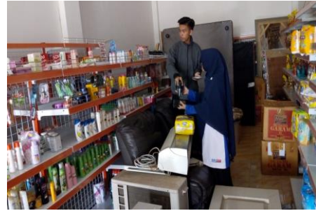
Gambar 3. Peserta menyusun barang berdasarkan jenis produknya