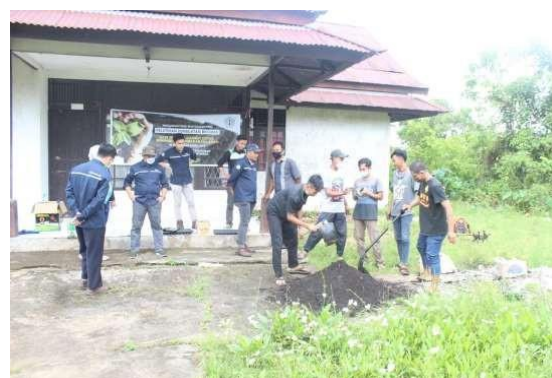
Gambar 9. Proses Pencampuran Media Tanam dengan Biochar

Media tanam yang digunakan untuk budidaya tanaman cabe dicampur dengan biochar dengan perbandingan 1:1 yang dimasukkan kedalam polybag kemudian bibit cabe ditanam pada polybag tersebut dan dipelihara secara normal hingga panen untuk mengetahui pengaruh biochar terhadap pertumbuhan dan produksi tanaman sayuran terutama cabe (Gambar 8).