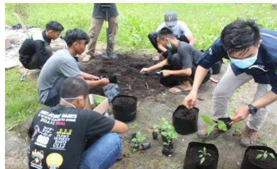
Gambar 8. Proses Penanaman Tanaman Cabe sebagai Indikator

Biochar yang dihasilkan dari kegiatan sebelumnya pada tahapan ini digunakan sebagai amelioran dan dicampurkan pada media tanam (Gambar 9). Pada kegiatan ini tanaman cabe digunakan sebagai tanaman indikator dalam untuk memberikan bukti kepada masyarakat tentang manfaat biochar bagi tanaman sehingga paradigma masyarakat lebih terbuka untuk melakukan pembakaran secara terkontrol.