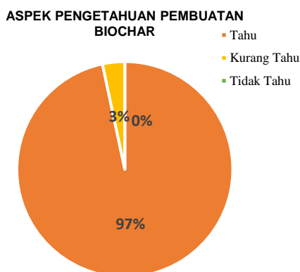
Gambar 4. Tanggapan Peserta terhadap Aspek Pengetahuan Pembuatan Biochar

Kegiatan ini ditekankan pada dampak negatif dari pembakaran lahan serta manfaat dari biochar. Biochar bersifat amelioran atau pembenah tanah yang dapat digunakan sebagai pendamping pupuk untuk meningkatkan efisiensi penyerapan pupuk oleh tanaman, menyediakan habitat bagi mikroba tanah, dapat mengikat air dengan baik, dan tidak mengganggu keseimbangan karbon-nitrogen dalam tanah. Niochar ini juga lebih efektif dalam renetensi hara dan ketersediaan hara bagi tanaman dibandingkan dengan bahan organik lainnya (Gani, 2009)