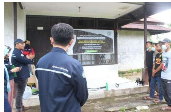
Gambar 3. Kegiatan Penyuluhan secara Langsung mengenai Biochar dari Serasah Gambut

Kegiatan penyuluhan diawali dengan pembukaan dan penjelasan tentang deskripsi serta bahan-bahan yang dapat digunakan dalam pembuatan biochar. Materi penyuluhan yang diberikan meliputi fungsi dan peranan biochar terhadap fisika, biologi, dan kimia serta lingkungan gambut yang digunakan untuk proses budidaya tanaman. Selain itu, kegiatan penyuluhan juga memberikan penekanan pada bahaya pembakaran lahan secara langsung sehingga perlu dilakukan pembakaran secara terkontrol agar mendapatkan efek yang baik untuk budidaya tanaman sekaligus meminimalisir efek negatif kerusakan lingkungan. Peserta antusias dalam mengikuti kegiatan ini, beberapa peserta mengajukan pertanyaan-pertanyaan yang mereka anggap kurang paham.