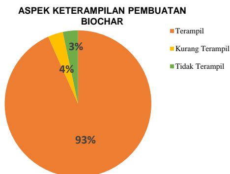
Gambar 7. Tanggapan Peserta terhadap Aspek Keterampilan dalam Pembuatan Biochar

Kegiatan ini ditekankan pada teknik pembuatan biochar dengan bahan dasar seresah tanah gambut secara pirolisis. Pirolisis adalah sistem pembakaran dengan sedikit atau tanpa oksigen. Biochar dapat dihasilkan dari sistem pirolisis dengan biochar yang dihasilkan sebagian besar dalam keadaan tanpa oksigen dan paling sering dengan sumber panas dari luar. Produksi biochar yang optimal adalah dalam keadaan tanpa oksigen.