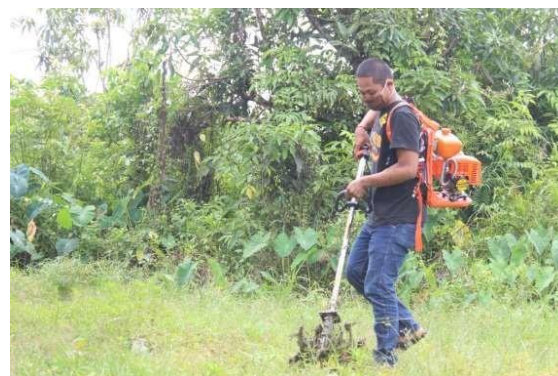
Gambar 6. Simulasi Penggunaan Alat Mekanisasi oleh Peserta PPM Rasau Jaya

Gambar 7 merupakan hasil survey kepada peserta pelatihan mengenai keterampilan dalam pembuatan biochar. Dari aspek keterampilan pembuatan biochar