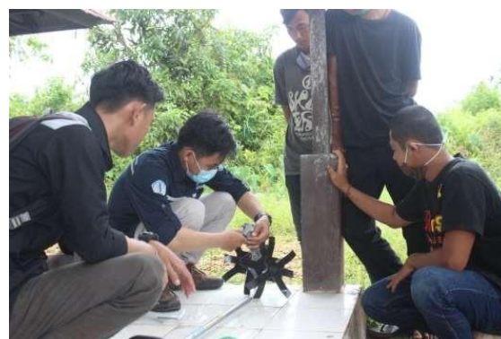
Gambar 5. Pemasangan Traktor Mini Tiller Berjenis Rotary pada PTO

gambut yang merupakan faktor penghambat bagi pertumbuhan tanaman karena menghasilkan asam organik yang membuat pH media tanam menjadi asam atau rendah. pengambilan serasah gambut dapat dilakukan secara manual menggunakan cangkul dan parang serta menggunakan alat mekanisasi agar proses pengambilan serasah gambut dapat berjalan efektif dan efisien. Alat mekanisasi yang digunakan untuk mengambil serasah gambut adalah mini tiller yang menggunakan mata traktor rotary yang dipasang pada PTO. Setelah serasah gambut didapatkan, proses selanjutnya adalah pembuatan biochar menggunakan bahan dasar serasah gambut lalu dibakar dengan teknik pirolisis.