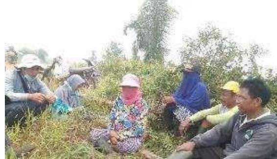
Gambar 2. Kelompok Tani Desa Rasau Jaya II

Mitra saat ini masih menerapkan sistem bakar lahan karena sudah mengakar dalam budaya masyarakat untuk melakukan pembakaran lahan sebelum melakukan cocok tanam. Walaupun dari hasil wawancara mitra telah mengetahui bahwa aplikasi kapur dapat meningkatkan pH dan kesuburan tanah, tetapi metode ini menurut mereka tidak efektif dan efisien. Mitra saat ini sulit dalam mengendalikan api yang menyebar akibat pembakaran yang mereka lakukan dan dihadapkan pada dilema pidana pembukaan lahan dengan cara membakar.