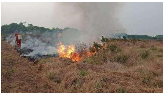
Gambar 1. Lahan di Desa Rasau Jaya II yang Terbakar dan Berusaha Dipadamkan

Desa Rasau Jaya II dikenal sebagai salah satu daerah dengan potensi gambut yang relatif besar di Kalimantan Barat. Desa ini juga dikenal sebagai penyumbang titik api di Kalimantan Barat yang disebabkan oleh pembakaran oleh masyarakat untuk kegiatan budidaya pertanian. Pembakaran lahan di musim kemarau kerap kali terjadi dikarenakan kebiasaan masyarakat Desa tersebut untuk meningkatkan kesesuaian lahan yang mereka miliki (Gambar 1). Paradigma masyarakat yang menanggapi bahwa abu sisa pembakaran dapat menjadi amelioran yang membantu menyuburkan lahan relatif sulit diubah karena sudah mengakar dalam kehidupan masyarakat Desa Rasau Jaya II. Oleh karena itu, masyarakat perlu dikenalkan teknologi lain yang mirip dengan kebiasaan mereka namun menimbulkan resiko kerusakan yang lebih kecil.