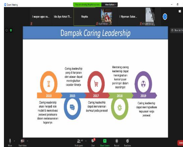
Gambar 3. Pelaksanaan Webinar Caring leadership

Selama pelaksanaan kegiatan, tidak ada kendala berarti terkait sinyal. Para peserta menunjukkan antusias yang cukup baik selama kegiatan webinar berlangsung. Semua peserta mengikuti dan menyimak kegiatan dari awal hingga akhir. Para peserta aktif memberikan respon terhadap penyampaian materi dan juga aktif bertanya terkait materi caring leadership yang telah di paparkan. Pelaksanaan kegiatan webinar melalui zoom meeting dapat dilihat pada Gambar 3 berikut.