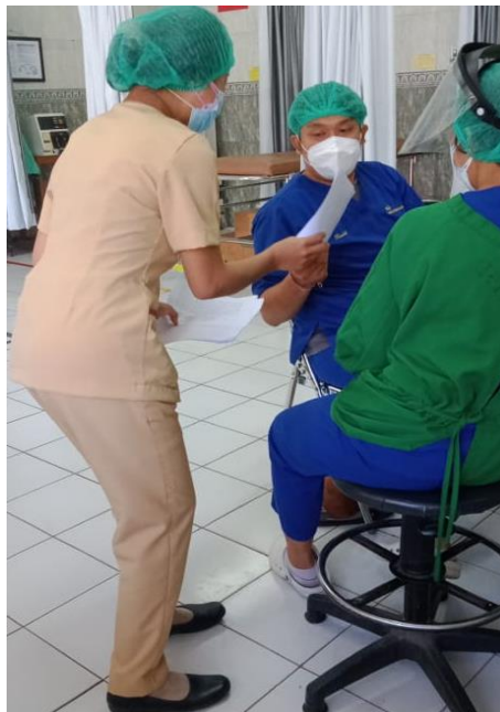
Gambar 2. Pelaksanaan Pre-tes (Menyebarkan Kuesioner Pre-Tes)