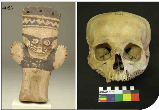
Fig. 1. Analogie tra la collezione antropologica e la collezione etnografica relativa al Perù precolombiano: idoletto antropomorfo in terracotta n. cat. 4053 e cranio n. cat. 2265, entrambi caratterizzati da deformazione cranica di tipo intenzionale. Cultura Chancay (XI-XV d.C.).

ricerca integrata, tutt'ora in corso di studio e applicazione, e l'elaborazione di una serie di considerazioni estremamente significative, che riportiamo in dettaglio.