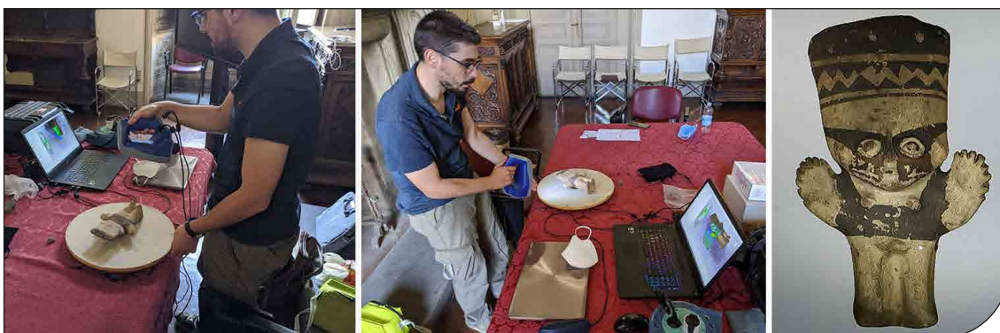
Fig. 2. Acquisizione e realizzazione del modello tridimensionale dell'idoletto antropomorfo in terracotta n. cat. 4053 relativo alla cultura Chancay tramite laser scanner Artec Spider (proprietà Dipartimento di Scienze della Terra, Università di Firenze).

Per quanto riguarda, invece, la collezione antropologica, sono necessarie alcune considerazioni, dal momento che i criteri di catalogazione dei resti umani, secondo gli standard ICCD, sono ancora in fase di definizione.