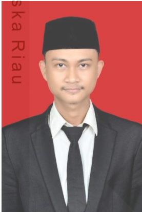
Riau Suska UIN