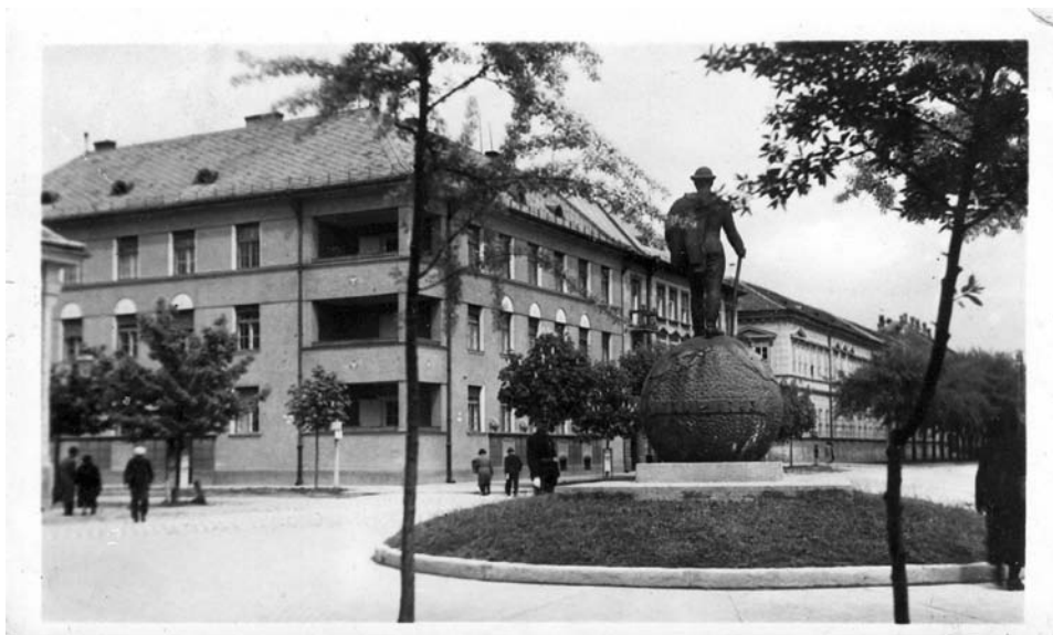
4. kép: „Üdvözet Bajáról” – a Jelky tér egy 1956-ban postára adott képeslapon

(Bácsalmás, Bátmonostor, Tataháza, Tompa, Érsekcsanád, Bácsbokod, Bácsborsód, Gara, Jánoshalma, Kiszállás, Nagybaracska, Nemesnáudvar, Mátételke, Madaras). A tanfolyamokra éppen az új gazdák nem mentek el, bár ezen a felügyelő személyes kiszállása kicsit változtatott. „A közművelés munkáját teljesen politikamentesen vezetjük, az egész népközönség érdekében.” 291,33 Emellett gazdanapokat is szerveztek.