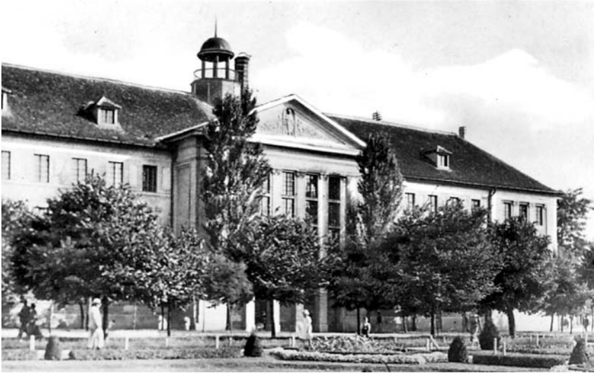
2. kép: Bács-Bodrog vármegyeháza Baján 1945 után