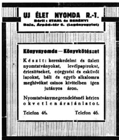
5. kép: Az Új Élet nyomda Rt. hirdetése a Bácskai Ujság 1939. április 5-i számából