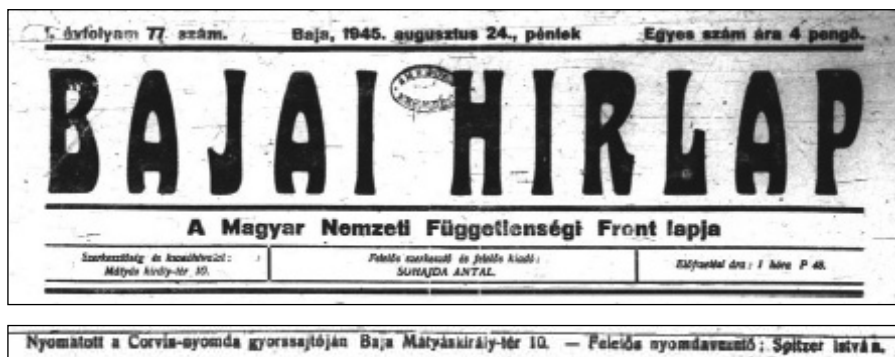
2. kép: Az 1945-ben megjelent Bajai Hirlap című újság fejléce és lábléce