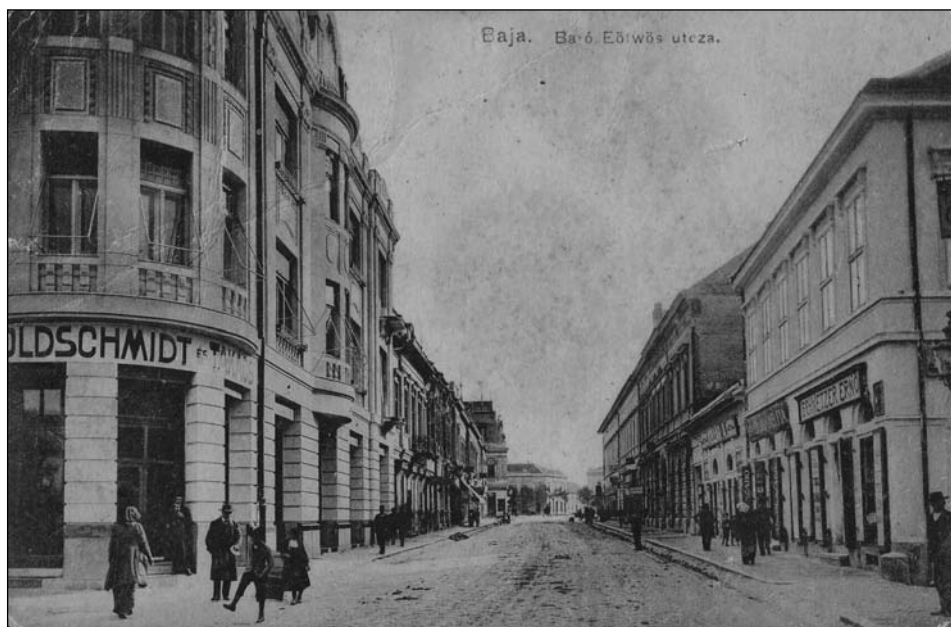
1. kép: Baja, Báró Eötvös utca a jobb oldalon látható földszintes épület a Kollár A. könyvkereskedés és könyvnyomda épülete (egy 1918-as képeslap)