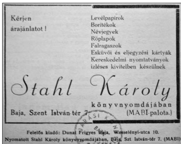
6. kép: Stáhl Károly nyomdájának hirdetése 1948-ból