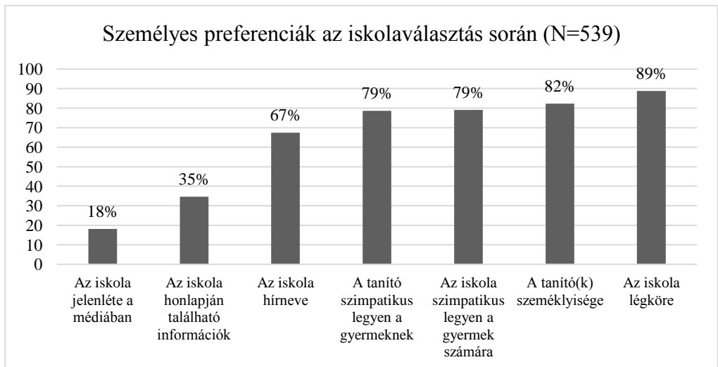
3. ábra: Döntő szempontok aránya az iskolaválasztás során a kitöltők személyes véleményei alapján (N=539)

A 3. ábrán látható, hogy a személyes preferenciák, vélemények fontosabbak a döntésnél, mint az iskolai jellemzők. A legfontosabb szempontok az iskolai légkör, a tanító(k) személyisége, illetve a gyermek véleménye az iskoláról és a tanítóról. Bár az információszerzés szempontjából a legfontosabb csatornáknak bizonyult az iskola jelenléte a médiában, illetve az iskola honlapja, a döntés során már ezek már nem annyira meghatározó szempontok a válaszadók szerint.