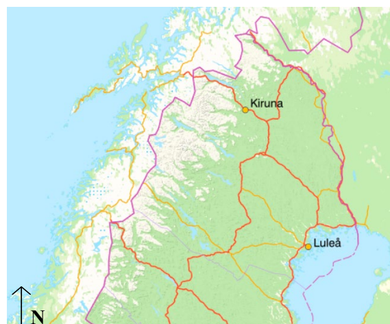
Figur 1: Kiruna är den nordligaste kommunen i Sverige. Skala 1:10 000 000. Lantmäteriet, 2021