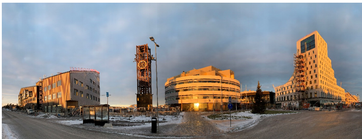
Figur 6: Panorama nya stadskärnan i november sol (Kiruna kommun, 2021)

2018a). Vissa ska flyttas och vissa ska få nya konstverk. Ett nytt modernt Kiruna, med kultur som bottnar i stadens traditioner beskriver kommunen målet som. Detta är ett estetiskt ingrepp och kan vara ett sätt för kulturvärde att växa med staden.