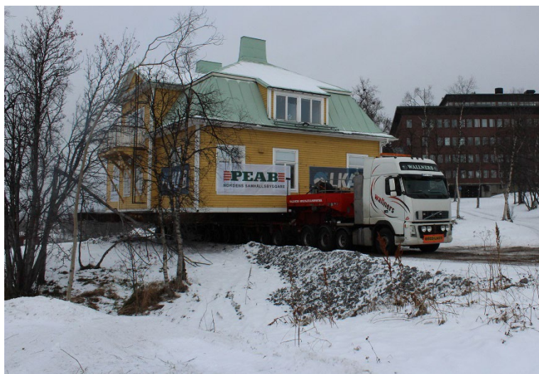
Figur 4: Länsmansbostaden flyttas (Kiruna kommun, 2019)