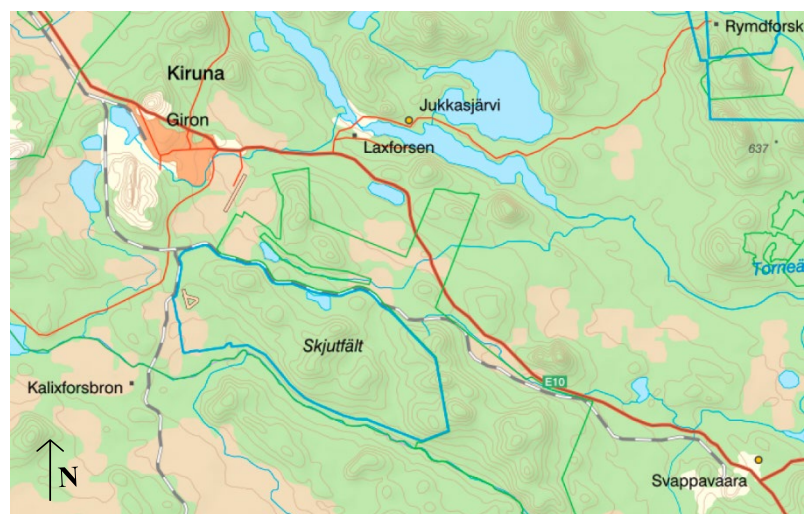
Figur 2: Karta Kiruna, Jukkasjärvi och Svappavaara. Skala 1:500 000 SWEREF (Lantmäteriet, 2021)

Kommunen tackar i sin översiktsplan gruvbrytningen (specifikt gruvföretaget LKAB) som anledningen till att staden grundades.