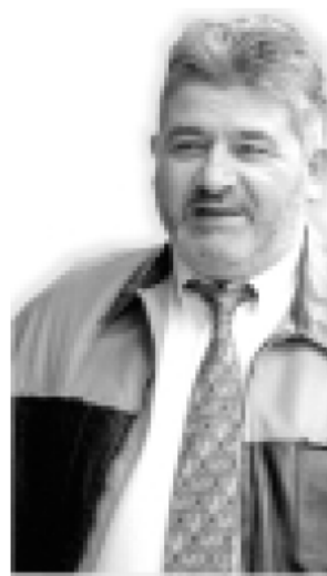
Ilustración 1. Cruce de Acusaciones. La Voz de Galicia (2000)

■ <Una señora que tiene un nivel cultural más o menos como el mío, que esté de diputada o de tal, pues ya me contarás>