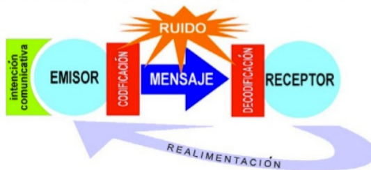
Figura 11. Modelo de comunicación de Juan C. Asinsten