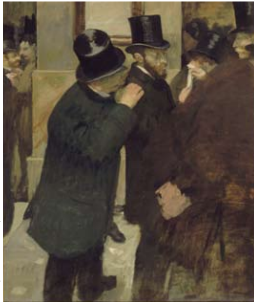
Fig. 1 : « Portraits à la Bourse » : ce tableau, réalisé par Edgar Degas vers 1878-79, est exposé au musée d'Orsay, à Paris.

et susceptibles de présenter des discontinuités (des « sauts »). Puis le calcul stochastique s'est développé grâce à la théorie de l'intégrale stochastique, mise au point par le Japonais Kiyoshi Itô (1915-2008). Enfin, c'est à l'Américain Joseph Leo Doob (1910-2004) que l'on doit le concept de martingale*, abondamment